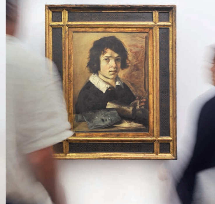
Giovanni Serodine, Ritratto di giovane disegnatore