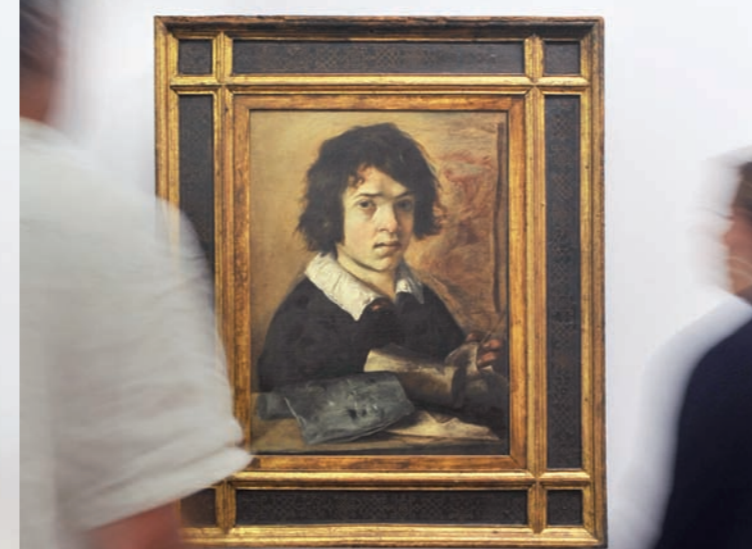
Giovanni Serodine, Ritratto di giovane disegnatore