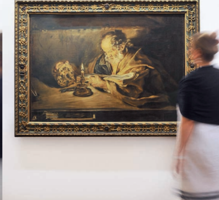
Giovanni Serodine, San Pietro in meditazione