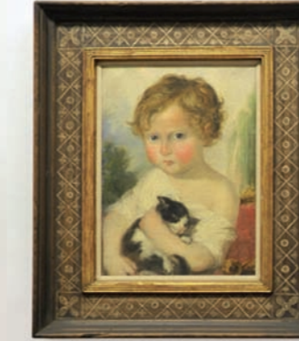
Antonio Rinaldi, Il gattino e Ritratto della carta squarciata