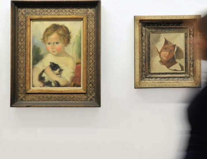
Antonio Rinaldi, Il gattino e Ritratto della carta squarciata