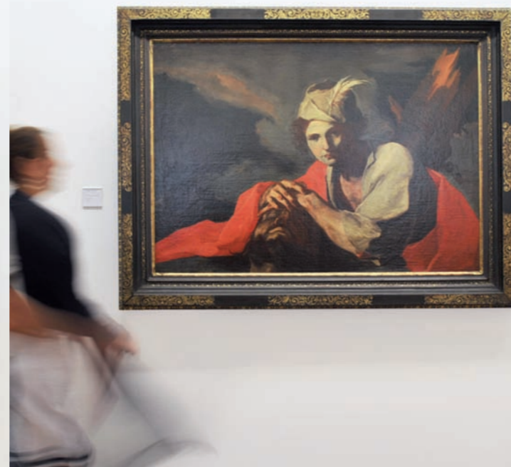
Giuseppe Antonio Petrini, Davide con la testa di Golia