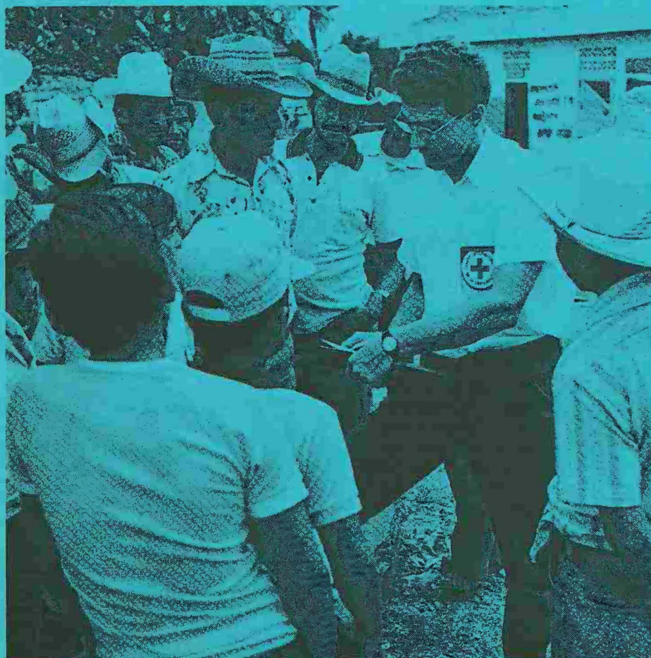
San Salvador: un delegato scrive, su dettatura, messaggi per i familiari dei detenuti.

Tutta la zona, dall'America centrale al Nicaragua, dal Salvador al Guatemala, è scossa, da 40-50 anni, da guerre, e politicamente credo che le origini del conflitto debbano essere ricercate nel periodo delle colonizzazioni. Attualmente, nel Salvador, nessuno è in condizioni di vincere e gli scontri dureranno probabilmente ancora molti anni. È un conflitto abbastanza cruento e i morti si contano a migliaia. Da una parte il governo e dall'altra il Fronte Farabundo Marti di Liberazione Nazionale (FMLN), quest'ultimo con un progetto di governo opposto a quello attuale, di estrema destra, molto caratterizzato soprattutto in un ambiente come l'America centrale. Non è comunque compito del delegato esprimere un giudizio politico e francamente, quando si vive il conflitto in modo più diretto di quanto si faccia a tavolo o davanti alla TV, si ha una percezione diversa della situazione. I problemi immediati che ci si pongono sono talmente enormi che non c'è assolutamente tempo di guardare al passato o al futuro. Il presente è fon-