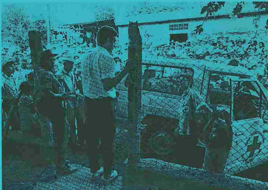
2 febbraio 1987: liberazione del colonnello Avalos in cambio di 57 prigionieri detenuti dal governo salvadoregno.

Noi interveniamo essenzialmente come agente esterno, neutrale. Evidentemente non vogliamo interporci in questioni fuori della nostra portata. Cerchiamo però di preservare, come già accennato, un minimo di umanità in questo conflitto. Ciò che ritengo legittimo è la nostra intromissione per problemi di carattere universale, umanitario, come il diritto alla vita, per tutti. Quando constatiamo che questo principio non viene rispettato, interveniamo energicamente, sia si tratti di un prigioniero, sia di un ferito. Certo, ci sono limiti che ci sforziamo di imporre: la popolazione civile può diventare, per la guerriglia e per l'esercito, un oggetto di contesa, la fame può essere uno strumento. In situazioni simili noi ripetiamo alle due fazioni che la popolazione civile non deve essere coinvolta in queste loro strategie. Facendo rispettare questo concetto umanitario, gior-