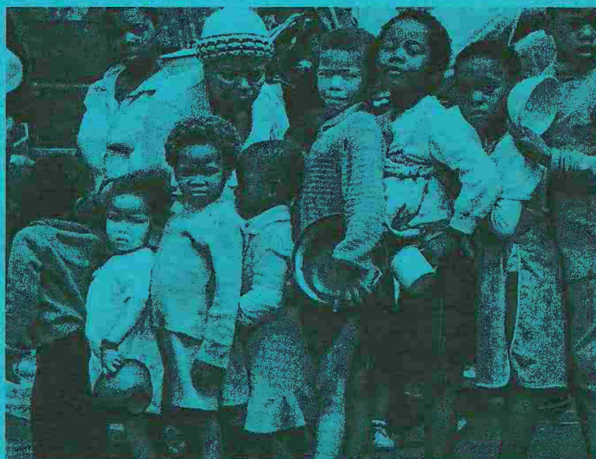
... in attesa di qualche cucchiaino di minestra.

Convenzione di Ginevra e Protocolli aggiuntivi: fino ad oggi 166 stati hanno aderito alle Convenzioni, mentre 80 paesi hanno per ora ratificato il Protocollo 1 e 71 stati il Protocollo 2; altri tre stati hanno comunque già annunciato di sottoscriverli: l'Ungheria (primo paese del Patto di Varsavia), il Canada e la Spagna.