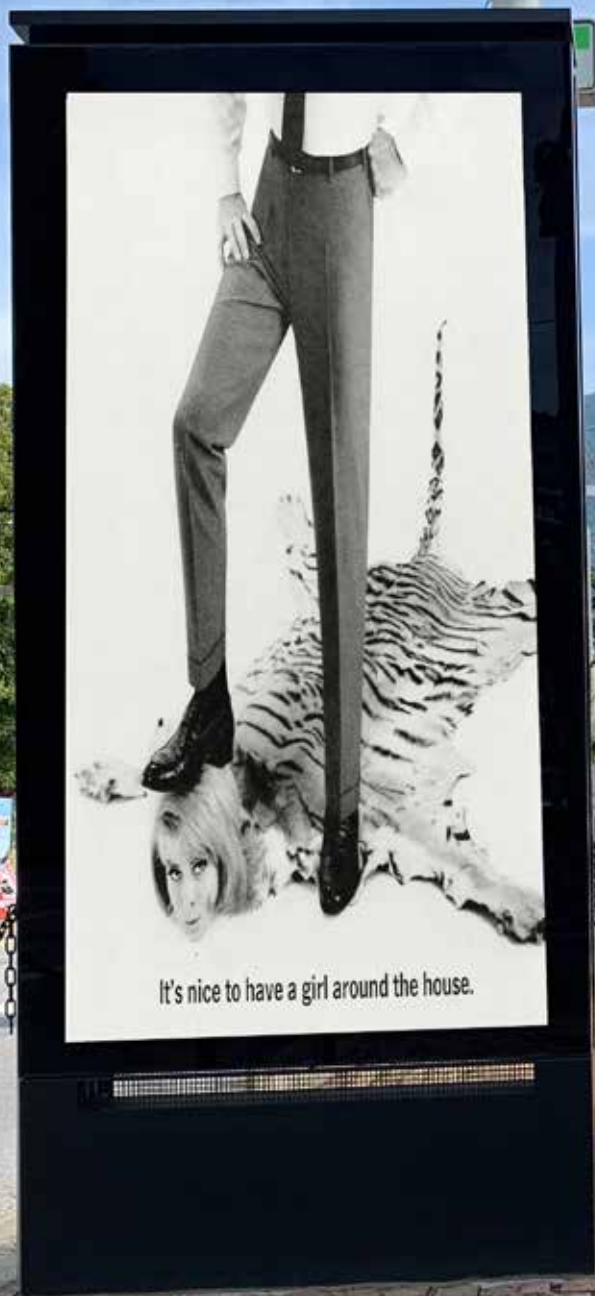
Cirica+Erre, "What about Herstory" 2019

installazione urbana, dimensioni site specific, Visione rendering dell'installazione presso il lungo lago, Lugano.