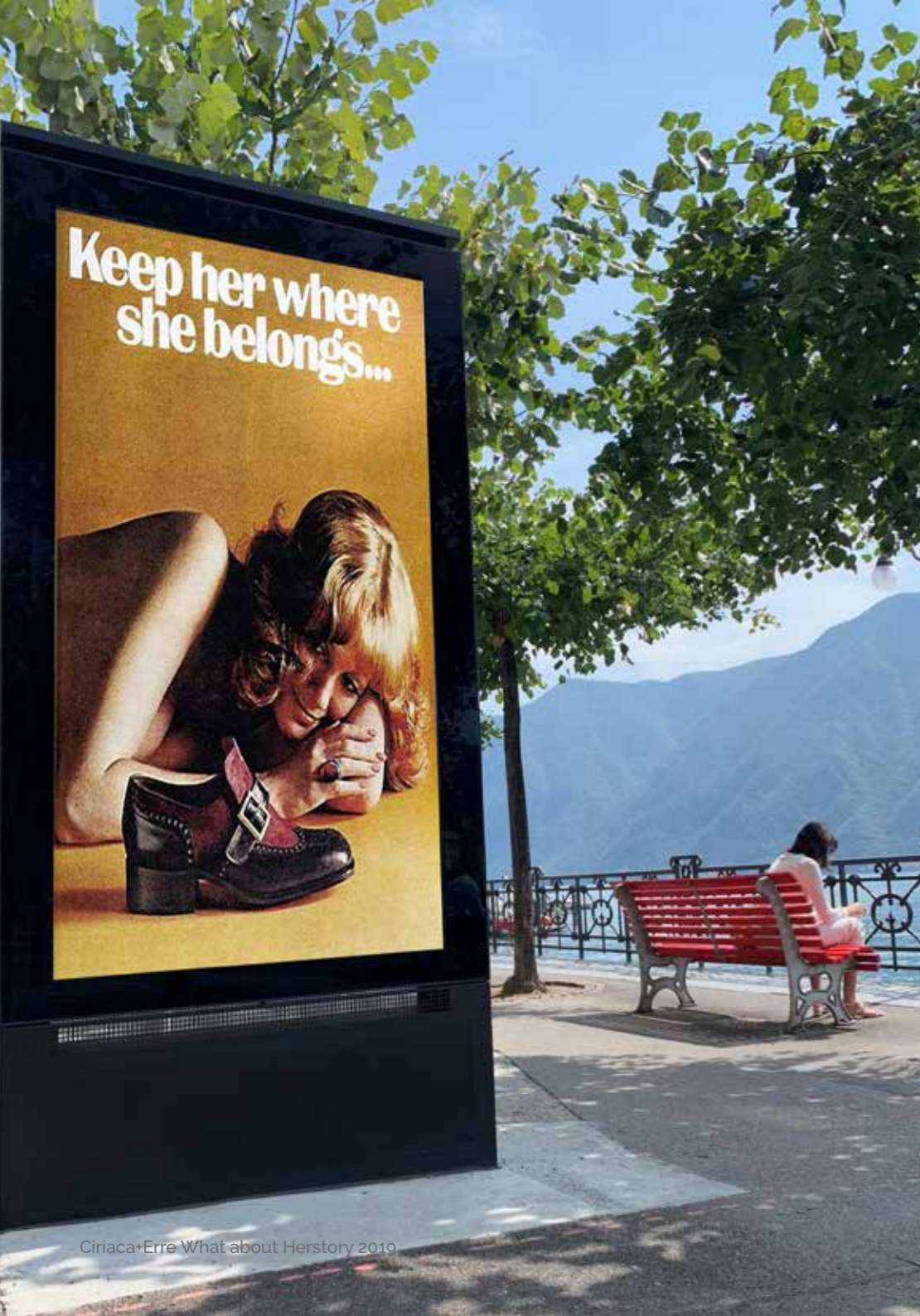
Ciriaca+Erre What about Herstory 2019

L'installazione urbana si compone di una serie di manifesti, le cui immagini trattano il tema dell'evoluzione dell'identità femminile per ricordare una data storica e sociale molto significativa: il 19 ottobre 1969 quando per la prima volta le donne poterono votare in Ticino, ben due anni prima rispetto alla Confederazione elvetica.