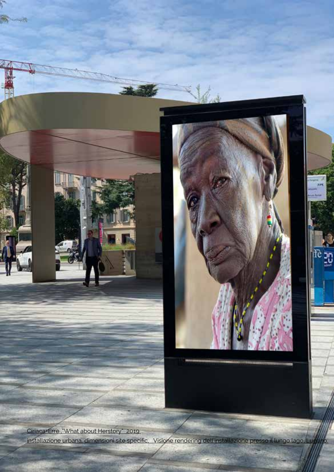
Ciriaca+Erre, "What about Herstory" 2019 installazione urbana, dimensioni site specific. Visione rendering dell'installazione presso il lungo lago, Lugano.

In occasione del 50° anniversario del suffragio femminile in Ticino,