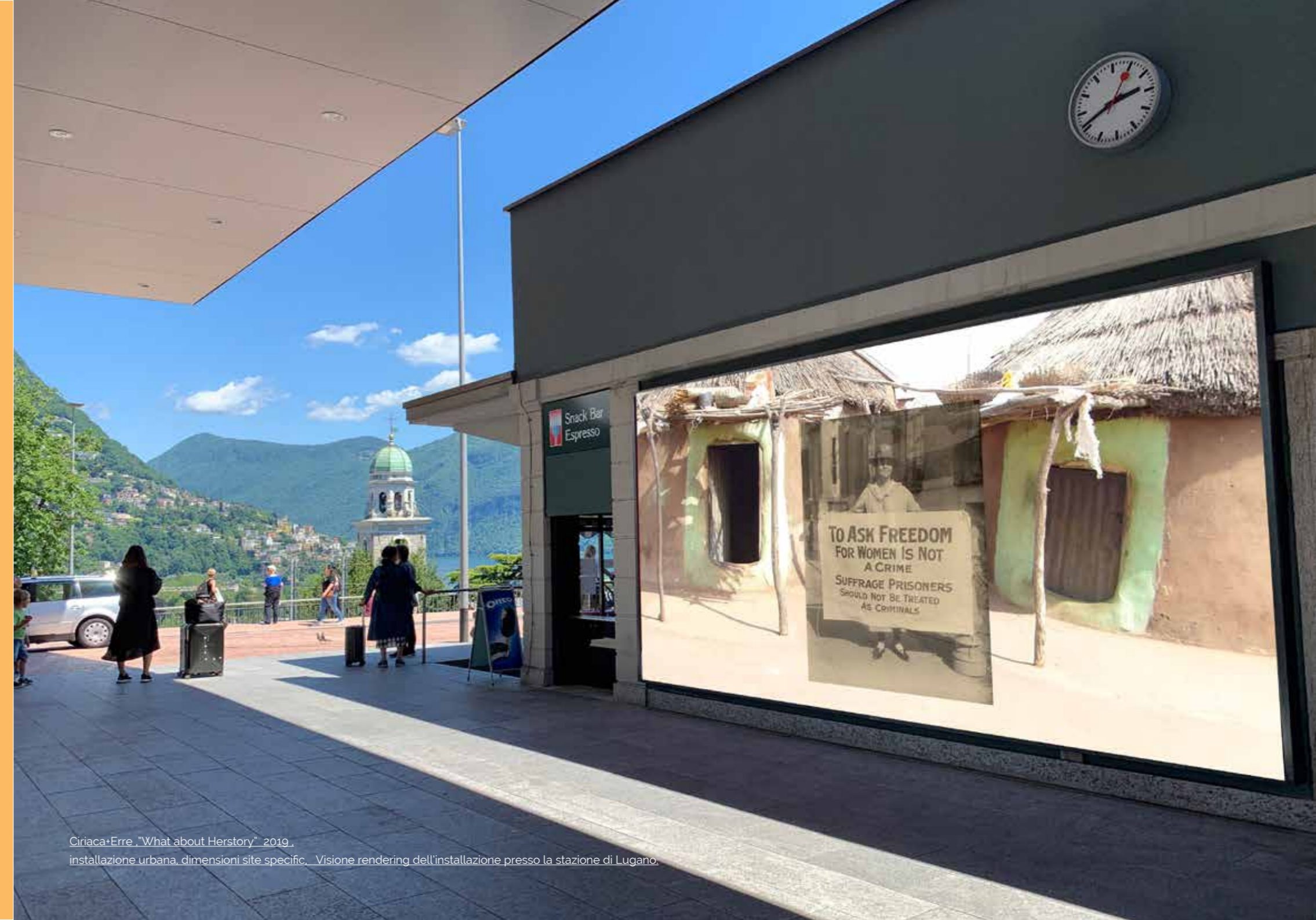
Ciriaca+Erre, "What about Herstory" 2019, installazione urbana, dimensioni site specific, Visione rendering dell'installazione presso la stazione di Lugano.

Ha partecipato al Padiglione Tibet, evento parallelo della 55° Biennale d'Arte/Venezia (2013). Ha esposto in differenti musei e gallerie tra cui: Buchmann Galerie/Lugano (2014), Mostyn Visual Arts Centre/Wales- UK (2015), MAMM - Multimedia Art Museum/Moscow (2012), Museo Macro Testaccio/Roma (2012), Museo della Permanente/Milano (2012), Istituto italiano di Cultura/Los Angeles (2011).