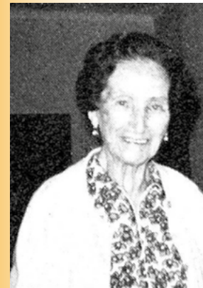
Rusca, Polia (Cholmetz 1884 - Locarno 1975)