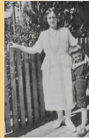
Volkart, Lilly (Zurigo 1897 - Ascona 1988)

alla «Ragion di Stato». Al fine di illustrare la vita e le opere dei Giusti scelti da una commissione di storici, la Fondazione Federica Spitzer e la Città di Locarno organizzano una serie di conferenze che si svolgeranno dal marzo al maggio 2026. Il Giardino dei Giusti di Locarno sarà inaugurato il 18 settembre 2026.