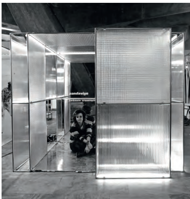
Nanda Vigo, Ambiente Cronotopico , 1968, Eurodomus, Torino, foto di Ugo Mulas © Archivio Nanda Vigo