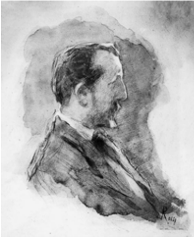
Luigi Rossi Autoportrait Milano 1900