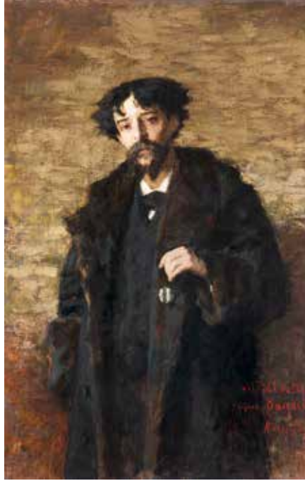
Portrait d'Alphonse Daudet par Luigi Rossi, Paris 1887