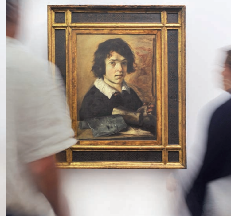
Giovanni Serodine, Ritratto di giovane disegnatore