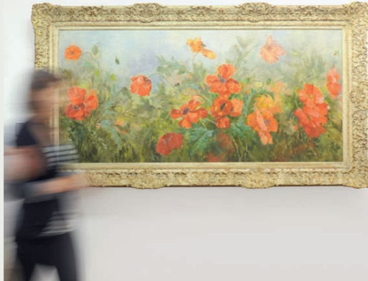
Gioachimo Galbusera, I papaveri

Giovanni Züst (Basel 1887 – Rancate 1976)