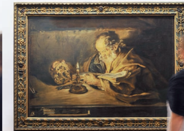
Giovanni Serodine, San Pietro in meditazione