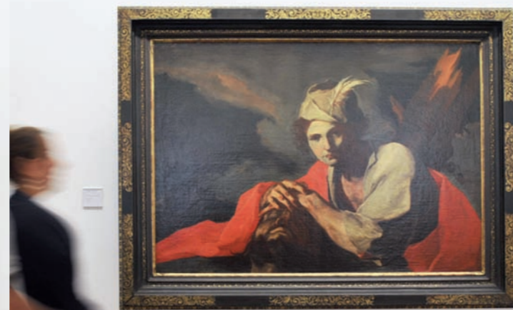
Giuseppe Antonio Petrini, Davide con la testa di Golia