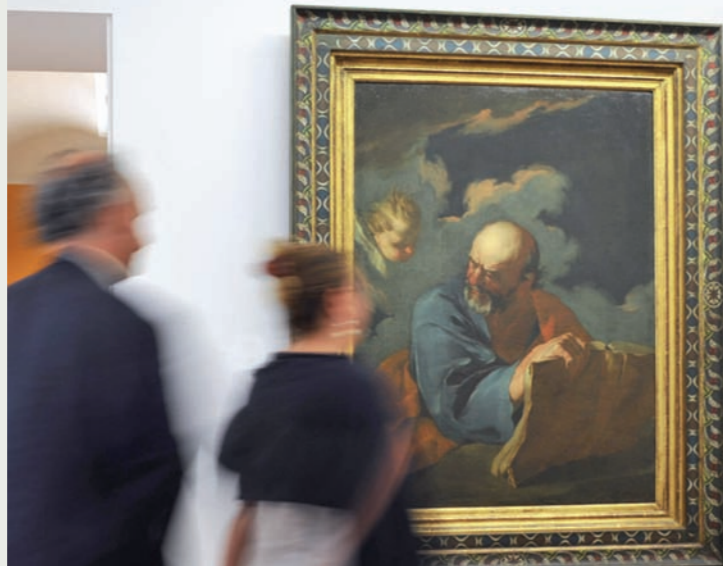
Giuseppe Antonio Petrini, San Matteo