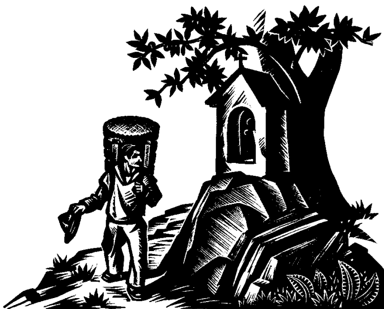
Aldo Patocchi, Il saluto dell'alpigiano di Brunescio , silografia, 1934