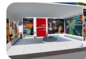
Arte applicata, arte