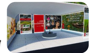
Agricoltura, orticoltura, selvicoltura, animali