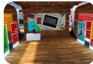
Il sistema formativo svizzero