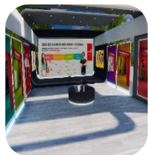
La Città dei mestieri della Svizzera italiana