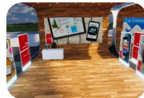
Cercare un apprendistato