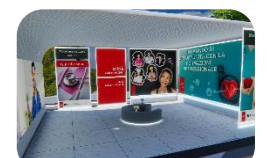
Medicina, salute, sociale