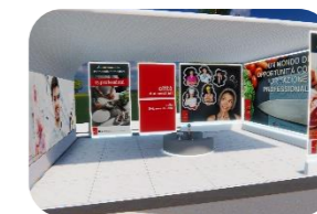
Alimentazione, economia domestica