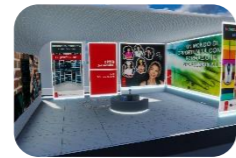
Informatica, multimedia, comunicazione