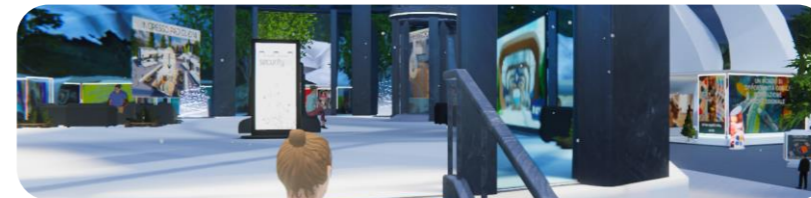
Area on demand - ingresso, al secondo piano area video on demand e al terzo piano terrazzo