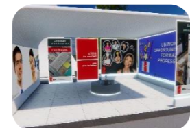
Economia e amministrazione