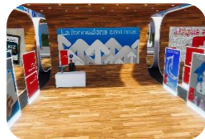
La formazione continua