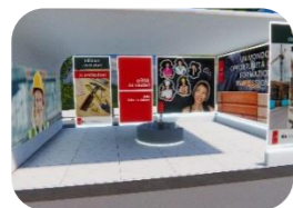
Edilizia e costruzioni