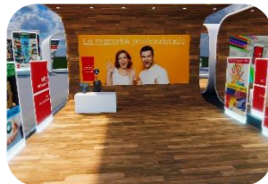
La maturità professionale