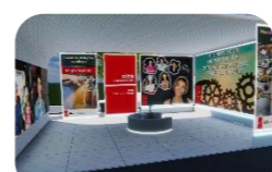
Meccanica, orologeria, metallurgia