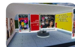
Tessili, cura del corpo