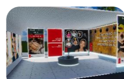
Legno, carta, cuoio