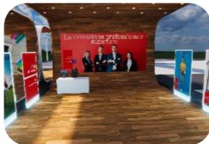
La formazione professionale superiore