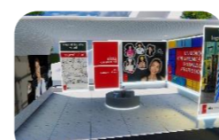
Trasporti, logistica, veicoli