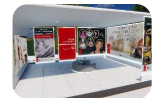
Albergheria, ristorazione, turismo