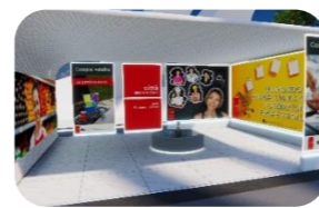
Compra e vendita