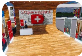
Lingue e mobilità