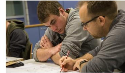
Formazione di base (abilitazione) Formatori e formatrici in corsi interaziendali, nelle scuole d'arti e mestieri o in altri luoghi della formazione