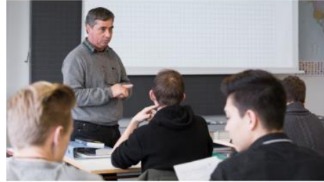
Formazione Insegnamento di cultura generale