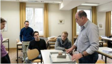
Formazione Insegnamento di materie professionali