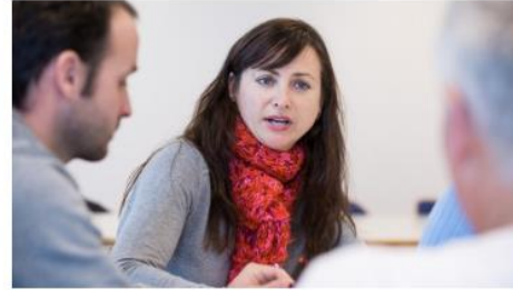
Formazione Insegnamento in una scuola che prepara alla maturità professionale