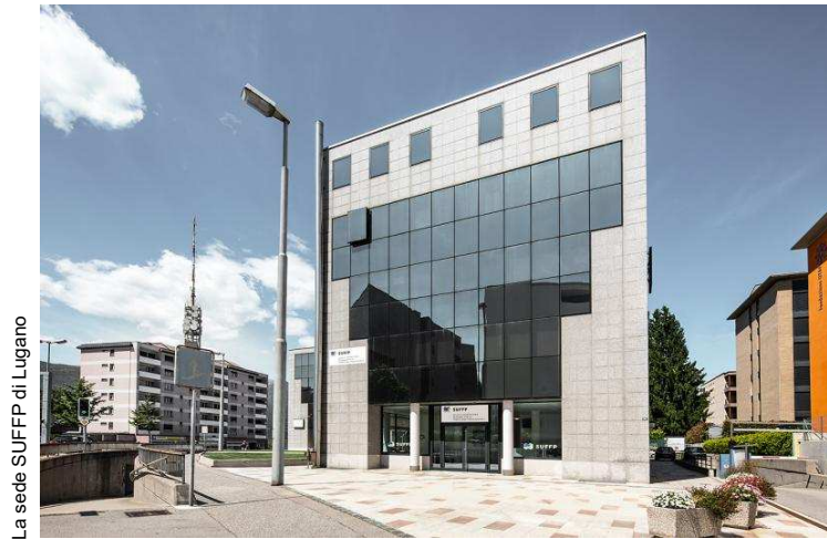
La sede SUFFP di Lugano