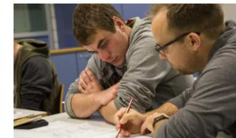
Formazione di base (abilitazione)

Insegnamento in una scuola che prepara alla maturità professionale