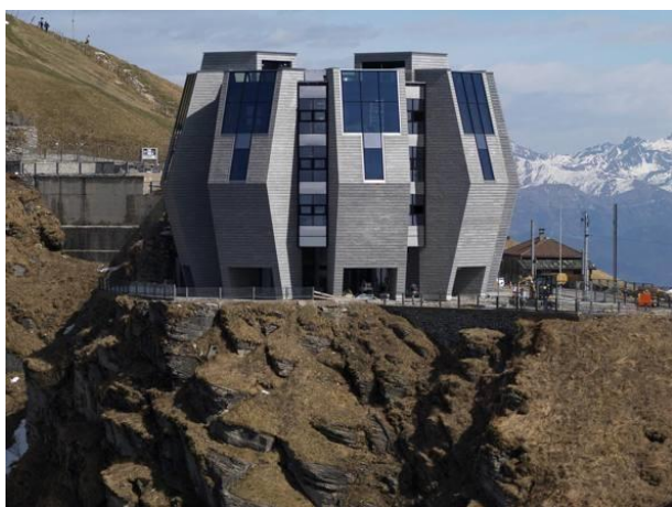
Treno d'epoca Figura 1: Fiore di Pietra