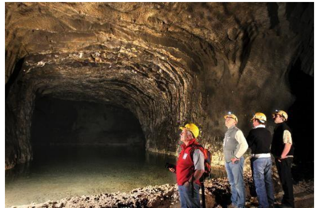
Figura 4: Interno della Grotta dell'Orso