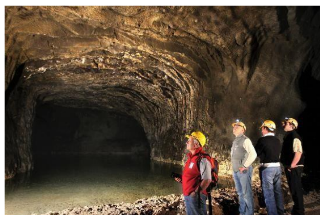
Figura 4: Interno della Grotta dell'Orso