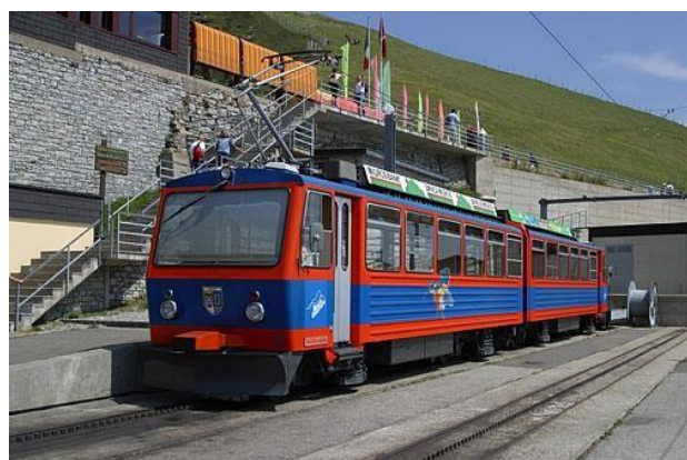
Figura 2: Attuale treno a cremagliera