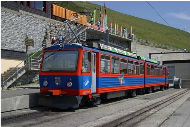
Figura 2: Attuale treno a cremagliera