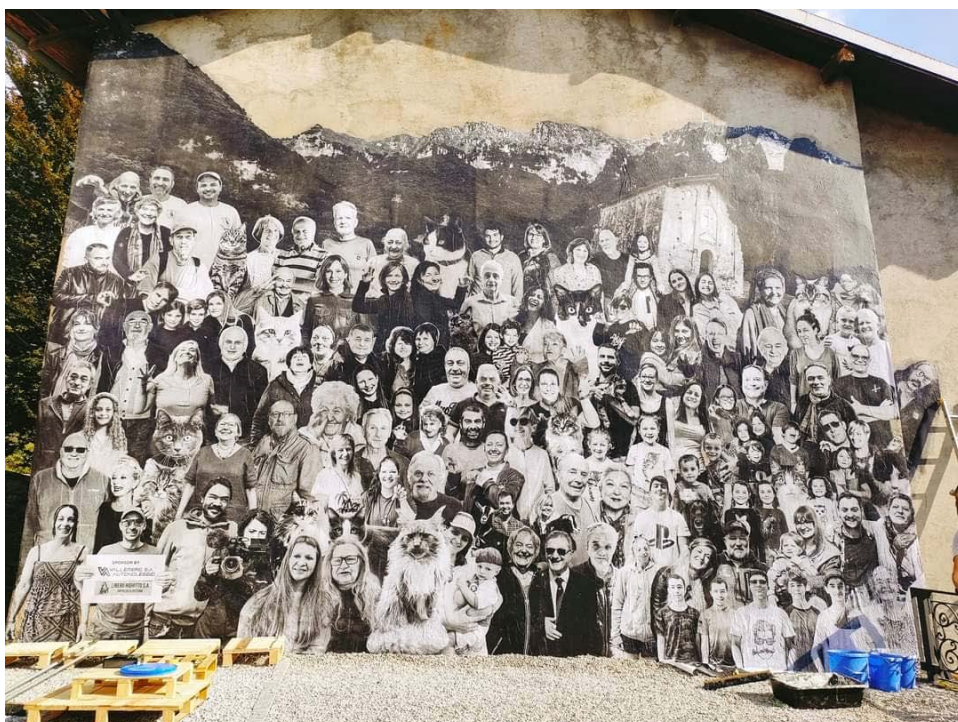
Murales "Wall of fame" (nell'angolo in basso a destra ci siamo anche NOI !!)