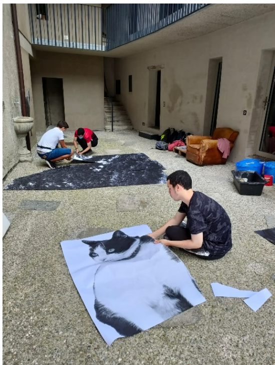
La montagna del Generoso e un gatto

Sullo sfondo del murales l'artista ha deciso di inserire il Generoso e la chiesetta di San Vigilio di Rovio. Viste le dimensioni molto grandi di queste due immagini le foto sono state stampate a pezzi e poi ricomposte da alcuni allievi prima di essere incollate alla parete.