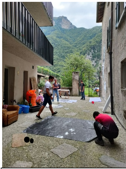
Montagna del Generoso