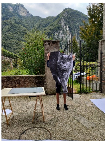
Uno dei tanti gatti