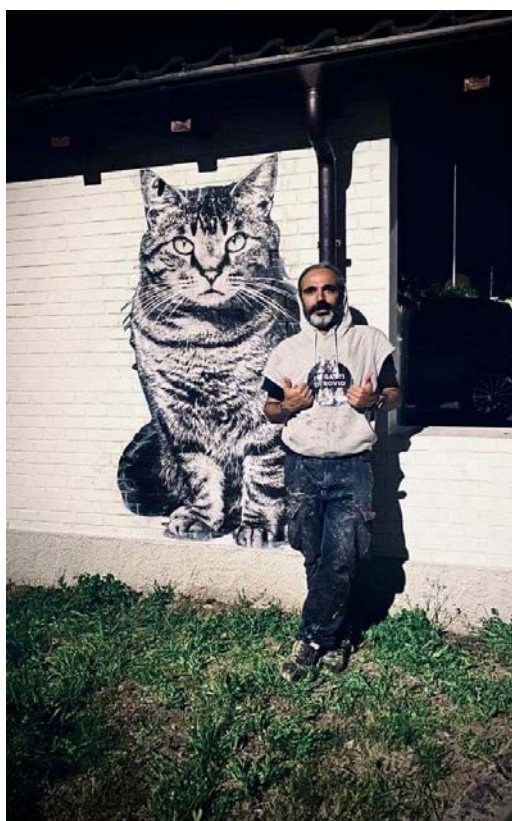
L'artista Yuri Catania