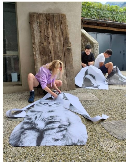
Ritaglio di gatti

Come prima cosa i ragazzi e ragazze della classe hanno aiutato a ritagliare le sagome che andavano poi a comporre l'enorme collage di immagini.