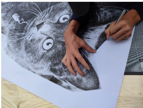
Taglio con il bisturi

Per ritagliare le immagini abbiamo usato forbici e bisturi.