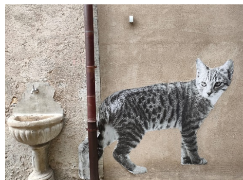
Uno dei tanti gatti

Il progetto prevede l'installazione di 60 fotografie di varie grandezze che ritraggono soprattutto gatti, in riferimento agli abitati di Rovio.