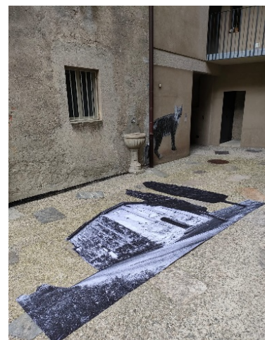
Chiesetta di San Vigilio

Sullo sfondo del murales l'artista ha deciso di inserire il Generoso e la chiesetta di San Vigilio di Rovio. Viste le dimensioni molto grandi di queste due immagini le foto sono state stampate a pezzi e poi ricomposte da alcuni allievi prima di essere incollate alla parete.