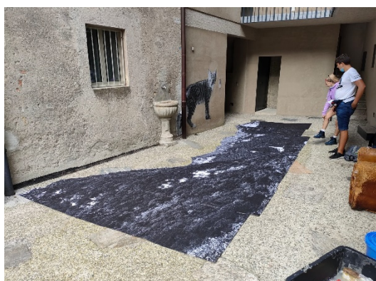
Fase di composizione del Monte Generoso