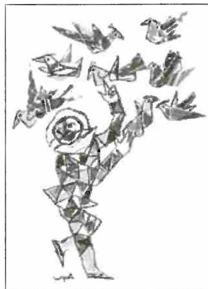
Il logo del FESTIVAL DEI BAMBINI (disegno del famoso scenografo e illustratore Emanuele Luzzati)

Dal 17 al 24 novembre avrà luogo la 14a. edizione di «Castellinaria-Festival internazionale del cinema giovane». Il Museo in erba vi collaborerà proponendo in loco degli ateliers legati ai film presentati alle classi: un'opportunità di riflessione e di espressione delle emozioni attraverso i colori. In occasione della giornata mondiale dell'infanzia, martedì 20 novembre si aprirà al pubblico dei più giovani anche il Teatro Sociale di Bellinzona che sarà una delle sedi del «Festival dei bambini» promosso dal prestigioso Piccolo Teatro di Milano nell'ambito della 3a. edizione del «Festival Teatri d'Europa». Martedì 20 e mercoledì 21 sarà di scena proprio il Piccolo Teatro di Milano con lo spettacolo «La scatola magica: sssst... Arlecchino racconta», un viaggio in compagnia di Arlecchino alla scoperta dei segreti del magico mondo del teatro. La celebre maschera – protagonista della pièce simbolo del Piccolo, lo storico «Arlecchino servitore di due padroni» diretto da Giorgio Strehler – prenderà per mano i giovani spettatori per raccontare come nasce un allestimento teatrale. Questo sarà solo il preludio di una serie di appuntamenti con compagnie dall'Italia, dalla Spagna, dal mondo arabo, ecc. che con i loro spettacoli divertenti e coinvolgenti affronteranno tra l'altro temi quali l'amicizia, la tolleranza, il rispetto, la dignità, ecc., e dunque convergenti con l'esposizio-