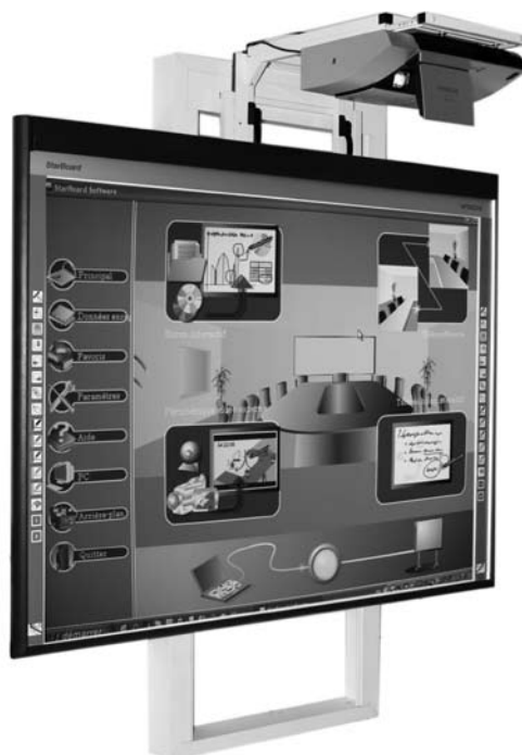
HITACHI STARBOARD FX-DUO

Via Sottobisio 30, 6828 Balerna – Tel. 091 – 683 51 43 Fax 091 – 683 99 57 - info@stilus.ch - www.stilus.ch