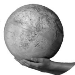
Logo del Progetto Risorse

Nelle pagine internet dedicate ai progetti sono a disposizione dei docenti una breve descrizione generale, una scheda per gli insegnanti contenente maggiori dettagli su cosa è possibile vedere, sul materiale didattico di supporto e sulle persone che possono essere contattate per approfondire tematiche particolari. Infine, è anche possibile scaricare il pieghevole ufficiale dei percorsi didattici. Indirizzo internet: www.scuoladecs.ch/svilupposostenibile/progetti-scuola-ticinese