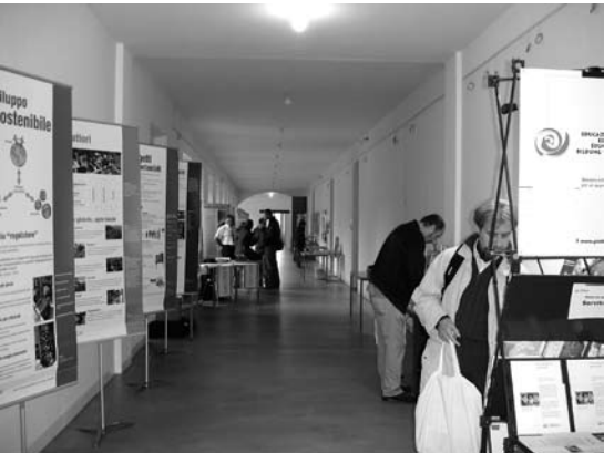
Un momento della giornata dedicata all'educazione allo sviluppo sostenibile

dotte sono state l'importante lavoro di rete che consente la valorizzazione del lavoro svolto dai diversi attori, la collaborazione fra diversi enti pubblici ed organizzazioni private e le dimensioni del progetto che spaziano dal livello cantonale a quello nazionale.