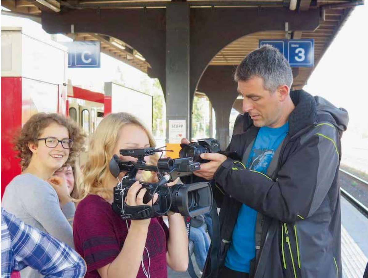
L'arrivo della 3B a Liestal

secondi, più specifici, avvicinavano gli allievi alle tecniche di recitazione e di ripresa, allo sviluppo di idee e di scrittura, infine alle tecniche di reportage.