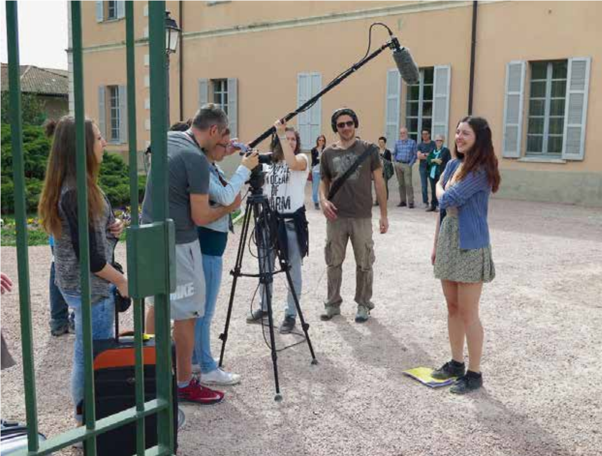
Le riprese a Mezzana

Il risultato, però, è qualcosa di più grande e profondo del solo prodotto finale e del messaggio in esso contenuto: è un'esperienza (non solo linguistica!) di condivisione, di conoscenza e rispetto delle altre culture e delle altre opinioni, di unione solidale.