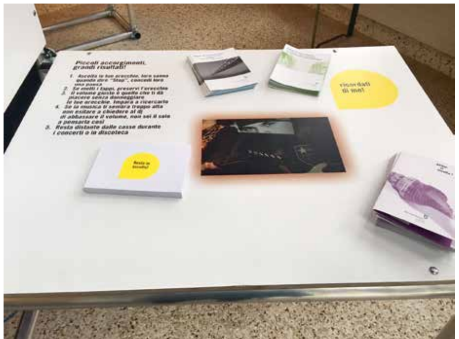
Alcune immagini delle attività promosse da ATiDU