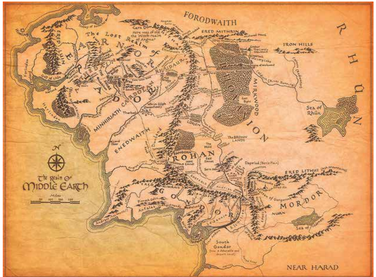
Mappa della Terra di mezzo (© Kevan Emmot)