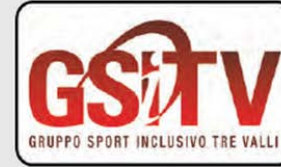
GSITV – Gruppo Sportivo Invalidi Tre Valli www.gsitv.ch