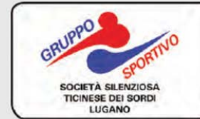
GS-SSTS – Gruppo Sportivo Società Silenziosa Ticinese dei Sordi www.ssts-lugano.com