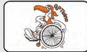
GPT – Gruppo Paraplegici Ticino www.gpticino.ch