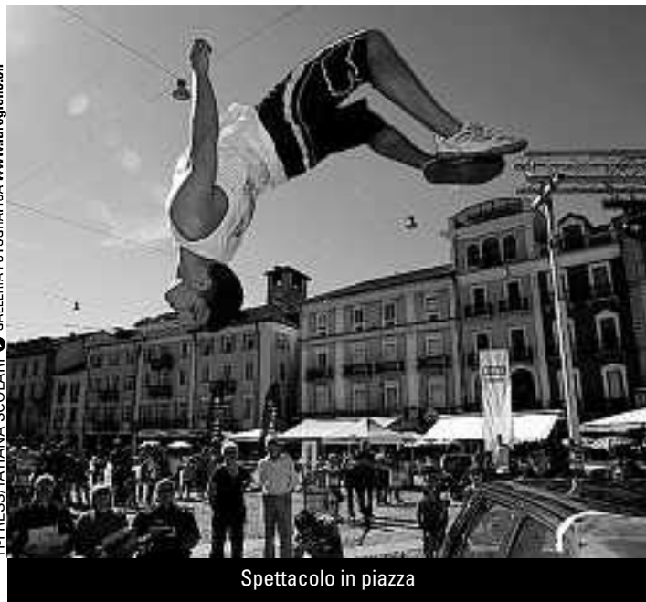
Spettacolo in piazza

Gradita dal pubblico, non è mancata l'animazione collaterale con la presenza della Intol Snowpark, del Dj Alex Pro e di altre sorprese, in una magnifica giornata di fine estate.