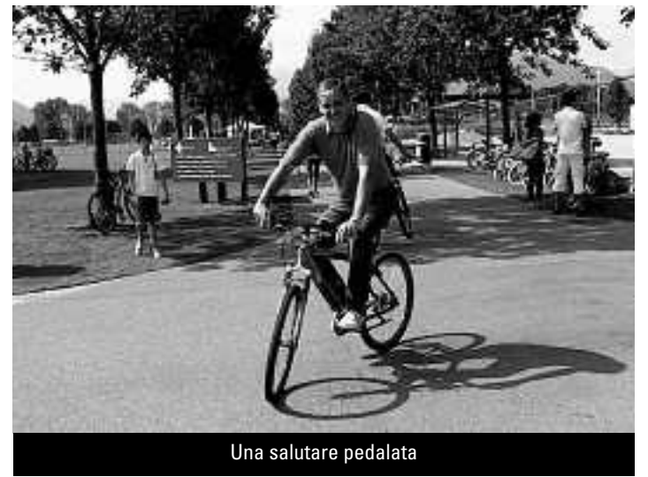
Una salutare pedalata

Provare nuovi sport ed assistere ad esibizioni mozzafiato. Anche l'edizione 2010 di Sportissima ha attirato una folta schiera di partecipanti al Centro sportivo di Tenero. Correr, saltare, giocare, veleggiare, tirare, arrampicare. Sportissima 2010 ha soddisfatto ogni palato. Al Centro sportivo nazionale della gioventù si sono contati più di tremila partecipanti entusiasti. Oltre a praticare una quarantina di discipline sportive, il pubblico composto di bambini ed adulti di ogni età ha potuto assistere a esibizioni di alto livello così come a due partite di football americano che hanno opposto i Landquart Broncos ai Hoheneims Blue Devils e i Lugano Lakers ai Winterthur Warriors. Molto apprezzate si sono dimostrate pure le altre novità della manifestazione: mountain bike e capoeira. Puntuale