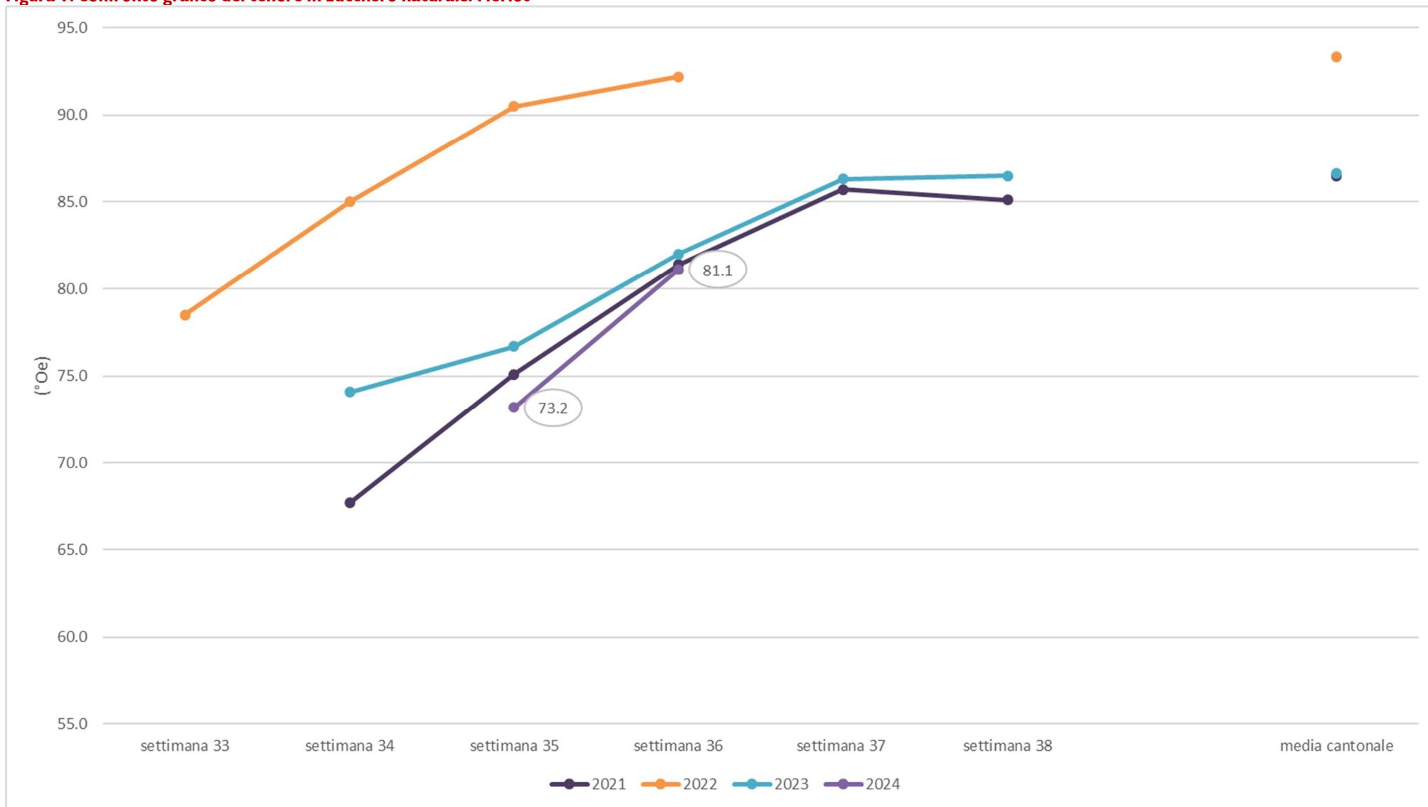
Figura 1: Confronto grafico del tenore in zucchero naturale: Merlot