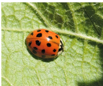
Harmonia axyridis su foglia di vite, Gudo 24.05