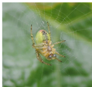
Ragno Dyctinidae su foglia di vite, Gudo 24.05

È possibile osservare nel vigneto diversi insetti che in alcuni casi sono parassiti occasionali e non richiedono interventi specifici.