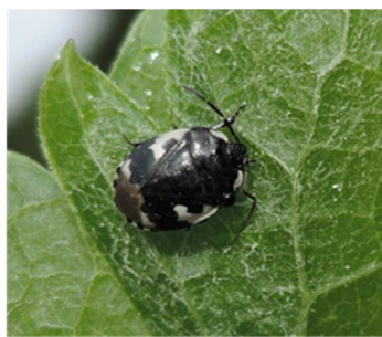
Tritomegas bicolor su foglia di vite, Gudo 20.05