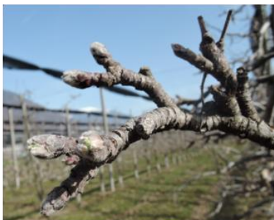
Melo, Breaburn , Sant'Antonino, 26.02 Stadio B , rigonfiamento gemme