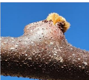
Kiwì, Biasca, 26.02 Stadio B , rigonfiamento gemme