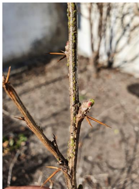
Crespino comune, Berberis vulgaris , Biasca, 28.02 Germogli con attacco precoce di afide verde migrante

Con le prime giornate miti è possibile che i primi afidi facciano la loro comparsa e attacchino i germogli freschi appena spuntati. La fotografia qui a fianco mostra una pianta ornamentale ( Berberis vulgaris ) dove il 28.02 sono stati rilevati degli afidi sui rametti appena entrati in linfa. Si tratta però dell'afide verde migrante ( Rhopalosiphum insertum ), che non costituisce una minaccia per le piante coltivate (proprio per la sua caratteristica di essere solo di passaggio nel giardino o nel frutteto). Dopo breve permanenza passerà sull'ospite secondario che è rappresentato da diverse graminacee dei generi Poa , Festuca , Agrostis , Allopecurus , ecc.). Questo afide può quasi essere considerato un ospite gradito, in quanto rappresenta una delle poche fonti di nutrimento già disponibile per gli insetti ausiliari predatori. Proprio per questo motivo, non è previsto alcun intervento mirato di difesa.