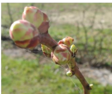
Mirtillo, Sant'Antonino, 26.02 Stadio B , rigonfiamento gemme