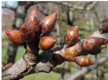
Ciliegio, Regina , Sant'Antonino, 28.02 Stadio B , inizio rigonfiamento gemme