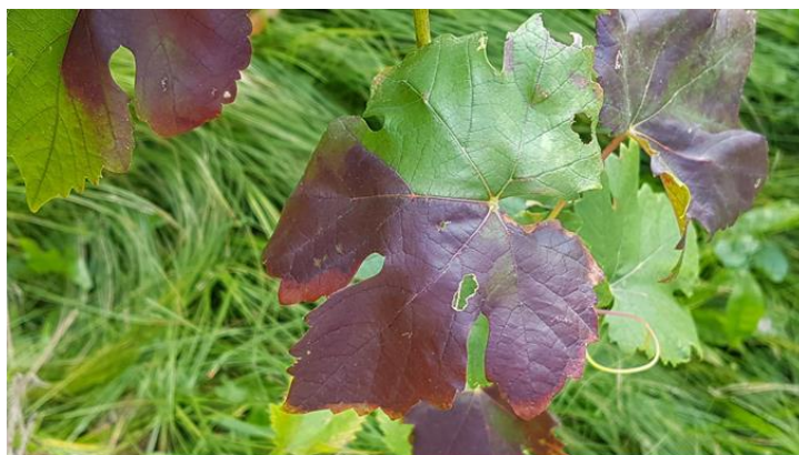
Sintomi di flavescenza dorata. Camorino, agosto 2020

La flavescenza dorata è una malattia della vite causata da un fitoplasma, che provoca la morte dei ceppi colpiti e per la quale non esistono trattamenti curativi. È una malattia di quarantena inserita nell'allegato 1 dell'Ordinanza del DEFR e del DATEC concernente l'ordinanza sulla salute dei vegetali (OSaV-DEFR-DATEC) e assoggettata all'obbligo di notifica e di lotta. Dalla scoperta del primo caso di flavescenza dorata della vite nel 2004, nonostante siano state messe subito in atto specifiche misure di eradicazione, la malattia ha continuato a propagarsi fino a interessare la quasi totalità delle aree vitate del Cantone Ticino.