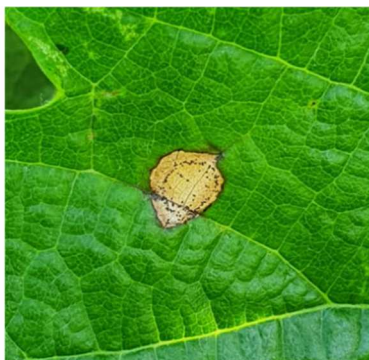
Black rot su foglia di Merlot, Biasca 31.05.2021 (sopra). Chardonnay, fioritura, Gudo 31.05.2021 (destra).

Ricordiamo che il momento giusto per l'intervento deve tenere conto della tipologia di prodotto utilizzato ma anche del tasso di crescita della vite, che in questa fase è abbastanza elevato. Inoltre è necessario determinare l'intervallo valutando non solo l'adeguata protezione nei confronti della peronospora, ma anche dell'oidio.