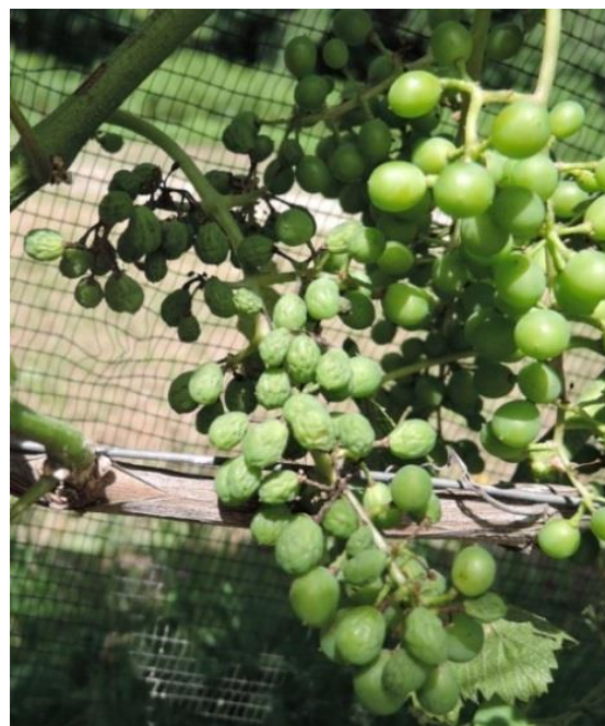
Sintomi di flavescenza dorata su Gamaret.