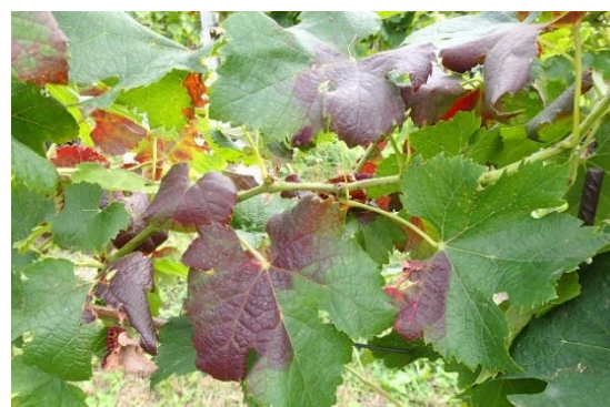
Sintomi di flavescenza dorata su Chardonnay (sinistra) e su Merlot (destra).