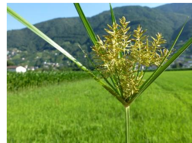
Zigolo dolce in fiore, i semi possono germinare e formare nuove piante.

Lo scorso 30 agosto il Servizio fitosanitario si è recato nella Valle del Reno a Salez (San Gallo) dove ha partecipato alla giornata informativa del gruppo di lavoro sullo zigolo dolce, una pianta invasiva che si diffonde tramite i semi e tubercoli (un tubercolo ha la capacità di produrne fino a 500 nella stagione successiva) presenti nell'apparato radicale. Nella prima parte della mattinata è stata presentata la situazione nella regione della Valle del Reno, dove lo zigolo dolce è diffuso principalmente nella parte superiore della Valle e in modo più contenuto verso sud. Un ufficio di consulenza ambientale ha poi presentato una strategia di lotta allo zigolo messa in atto in Liechtenstein, dove dal 2022 vige l'obbligo di