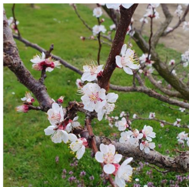
Albicocco, Luizet , Sant'Antonino, 13.03.2023 Stadio F, Piena fioritura