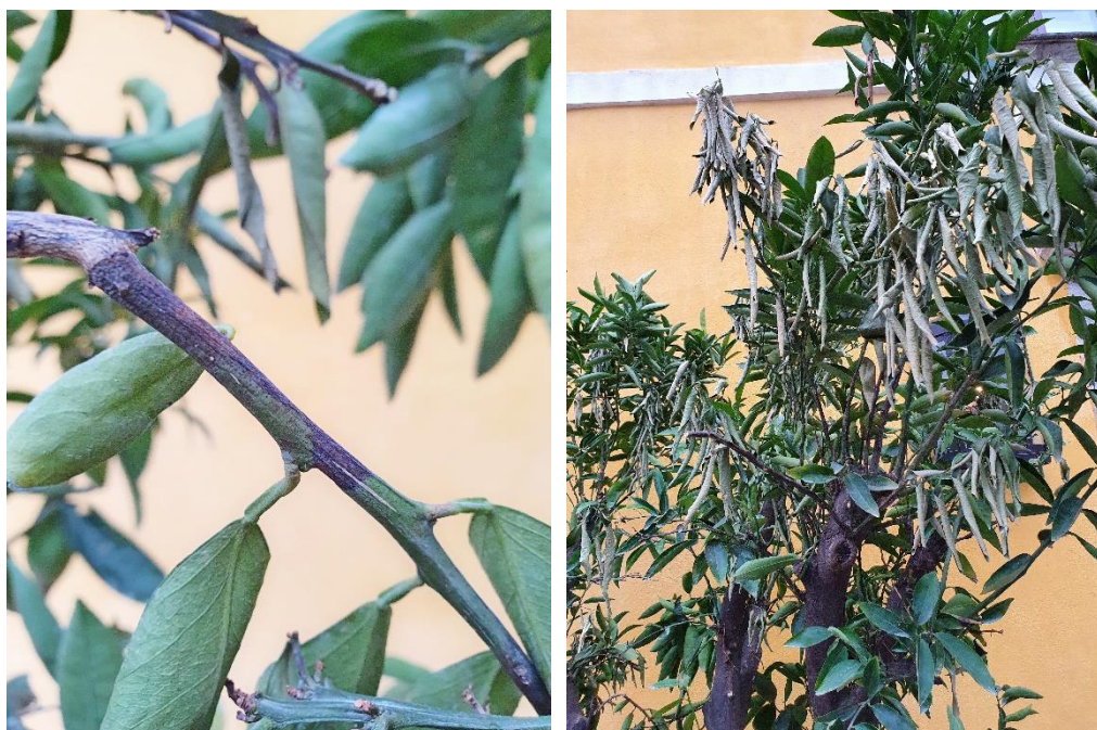
A sinistra: necrosi scure sui rami. A destra: disseccamento di foglie e rami.

avvenire in modo lento oppure rapido. I sintomi sono riduzione dello sviluppo, disseccamento e caduta delle foglie, disseccamento dei rami, necrosi sui rami. In alcuni casi si può inoltre manifestare un ingrossamento anomalo in prossimità del punto d'innesto. Alla fine la pianta attaccata muore. La malattia si diffonde per innesto o per mezzo di afidi.