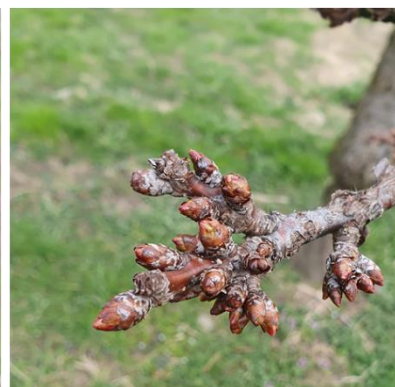
Ciliegio, Regina , Sant'Antonino, 13.03.2023 Stadio B, rigonfiamento gemme