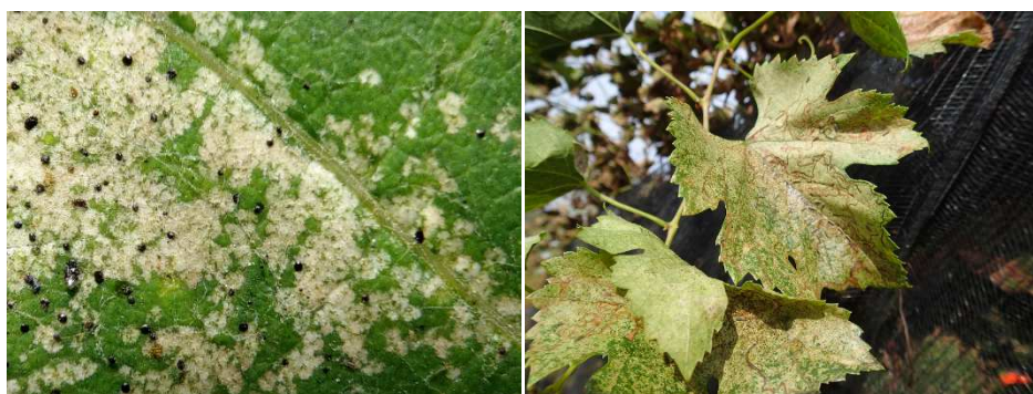
Figura 4 Danni di Erasmoneura vulnerata su foglie di vite. A sinistra un particolare di una foglia attaccata con le caratteristiche puntinature chiare e gli escrementi dell'insetto (punti neri).

La presenza del fillominatore Aspilanta oinophylla è rimasta generalmente costante rispetto al 2023, mentre è stato riscontrato un aumento della cicalina americana della vite Erasmoneura vulnerata , sia nel Sopraceneri che in alcune parcelle del Sottoceneri (Figura 4). Nella zona infestata del Sottoceneri si è assistito a un aumento delle catture di Popillia japonica , ma solo in alcuni vigneti fortemente colpiti è stato necessario intervenire per evitare danni alla produzione. I monitoraggi della flavescenza dorata hanno confermato la presenza costante della malattia in quasi tutto il territorio cantonale, eccezion fatta per alcune zone marginali.