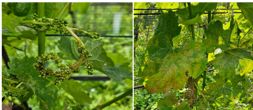
Figura 2 Attacco di peronospora su grappolo, Coldrerio 23 maggio 2024 (a sinistra), e forte attacco su foglia, Coldrerio 7 giugno 2024 (a destra).

A metà del mese di maggio sono state osservate le prime macchie d'olio di peronospora su foglie di vite nel Sottoceneri e nel Sopraceneri, e successivamente attacchi di peronospora su infiorescenze, soprattutto nel basso Ticino (Figura 2).