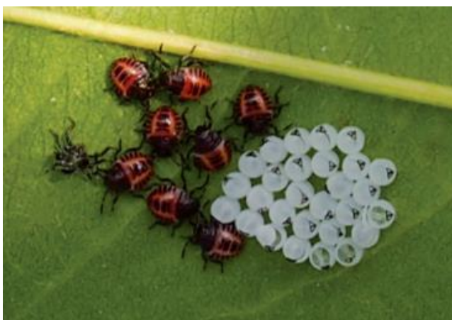
Uova e neanidi di H. halys