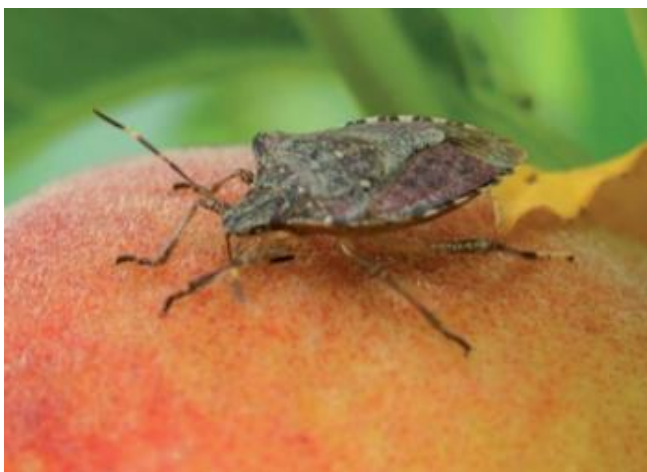
Adulto di H. halys

Maggiori informazioni sulla cimice marmorizzata sono disponibili sul sito del Servizio fitosanitario cantonale all'indirizzo https://www.ti.ch/fitosanitario/ oppure sul sito in tedesco: https://www.halyomorphahalys.com/ .