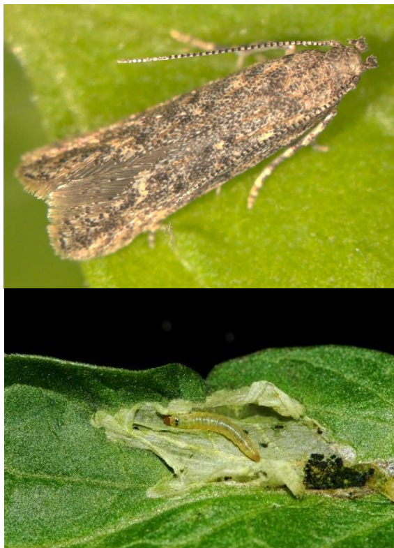
Adulto e larva di Tuta absoluta

In data 7 dicembre 2021 l'Ufficio federale dell'agricoltura ha rinnovato l'autorizzazione dell'impiego in caso particolare di ISONET T contro la minatrice del pomodoro Tuta absoluta . Il prodotto è autorizzato temporaneamente fino al 31.10.2022.