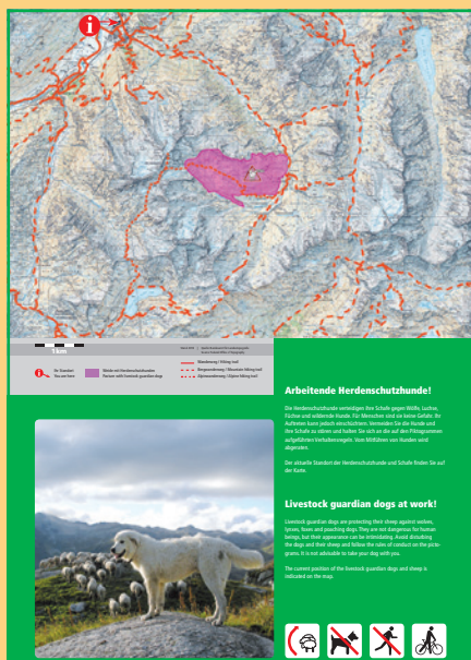
Esempio di inserto in due elementi per la tavola base più grande (ubicazione Andermatt UR).

Le tavole possono essere ordinati gratuitamente presso AGRIDEA, ma occorre fornire almeno i seguenti dati: