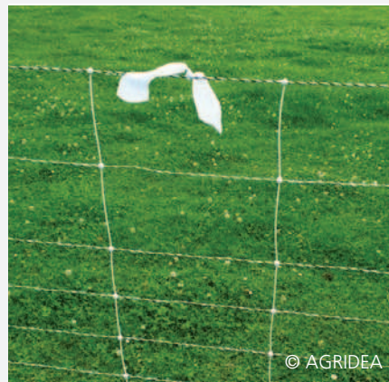
recinzione elettrificata con nastro segnaletico bianco

Scheda informativa: «Recinzioni di protezione per il bestiame minuto», AGRIDEA