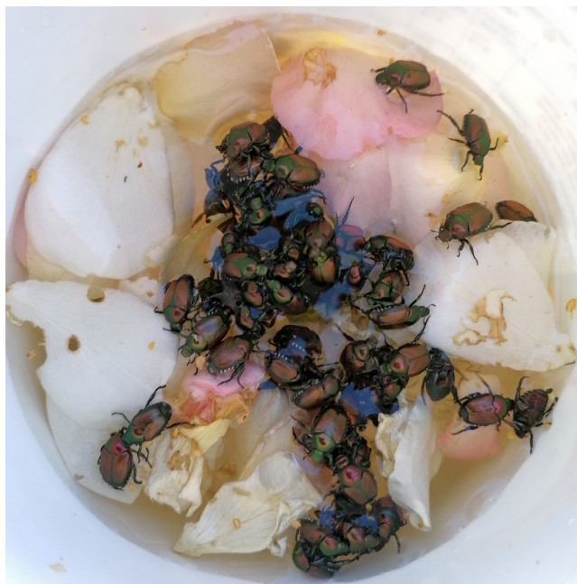
Risultato della cattura manuale.