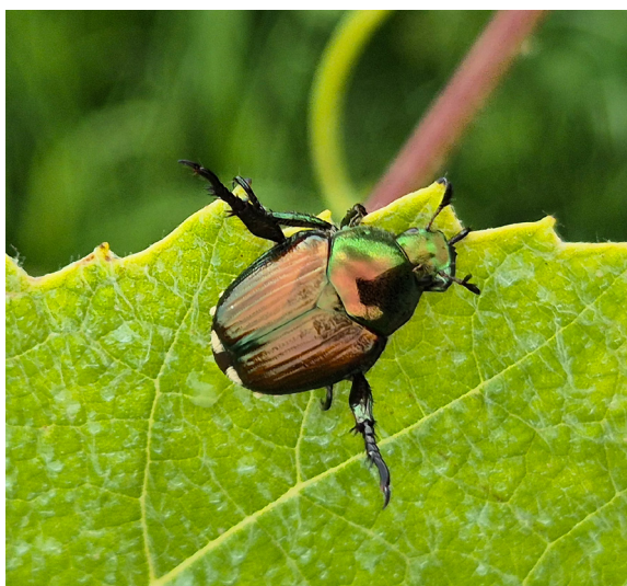
Adulto con le zampe posteriori estese verso l'alto.