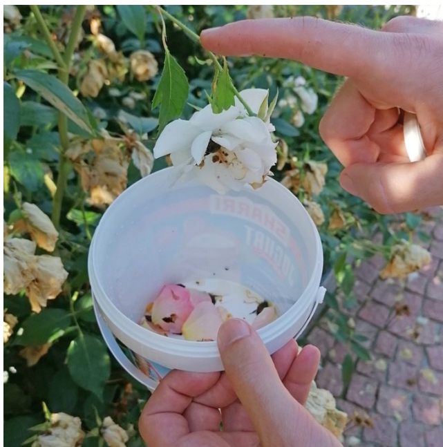
Cattura manuale con l'aiuto di un secchio.