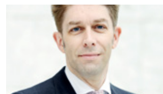
WINFRIED RUIGROK Professeur à l'Université de Saint-Gall