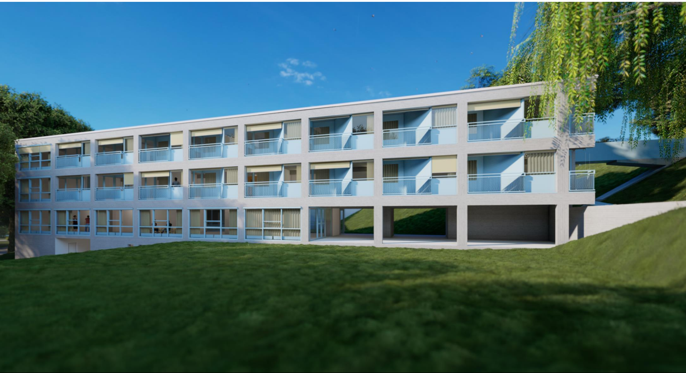
Vista facciata sud