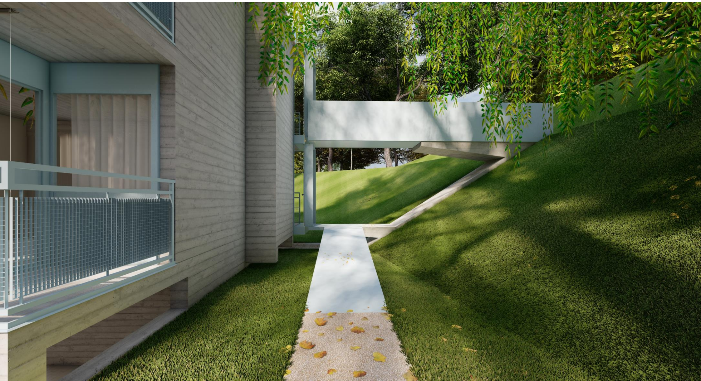
Vista passerella uscita di sicurezza con rampa 1P