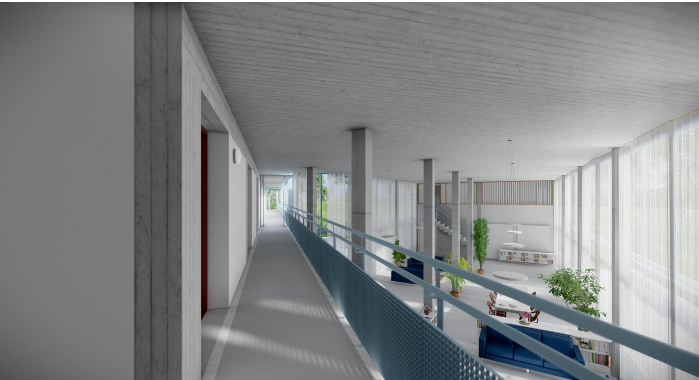
Vista da corridoio comune ala nord 2P