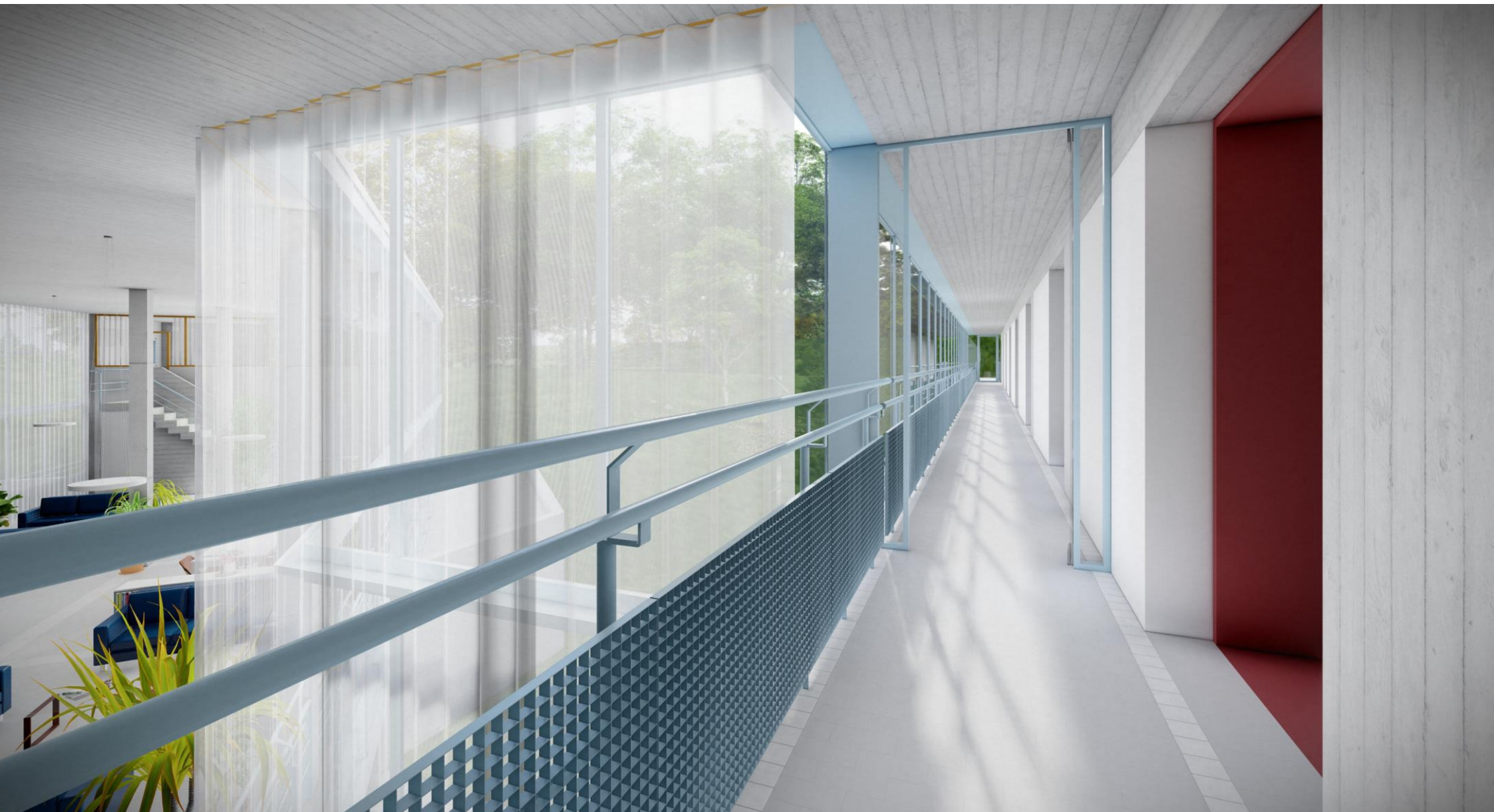
Vista compartimentazione corridoio comune 2P e dettaglio parapetto