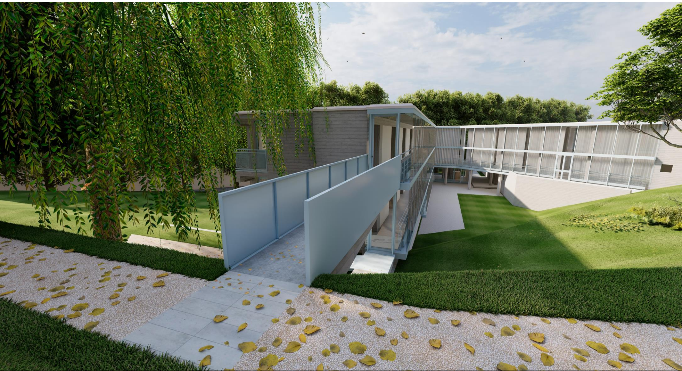
Vista passerella uscita di sicurezza al 2P