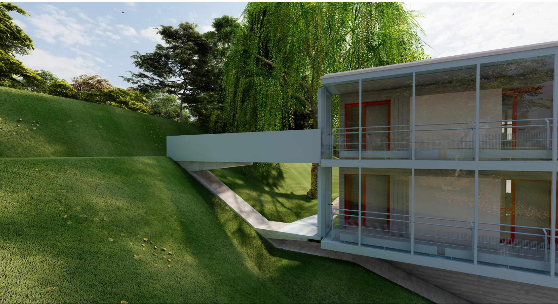
Vista passerella uscita di sicurezza al 2P