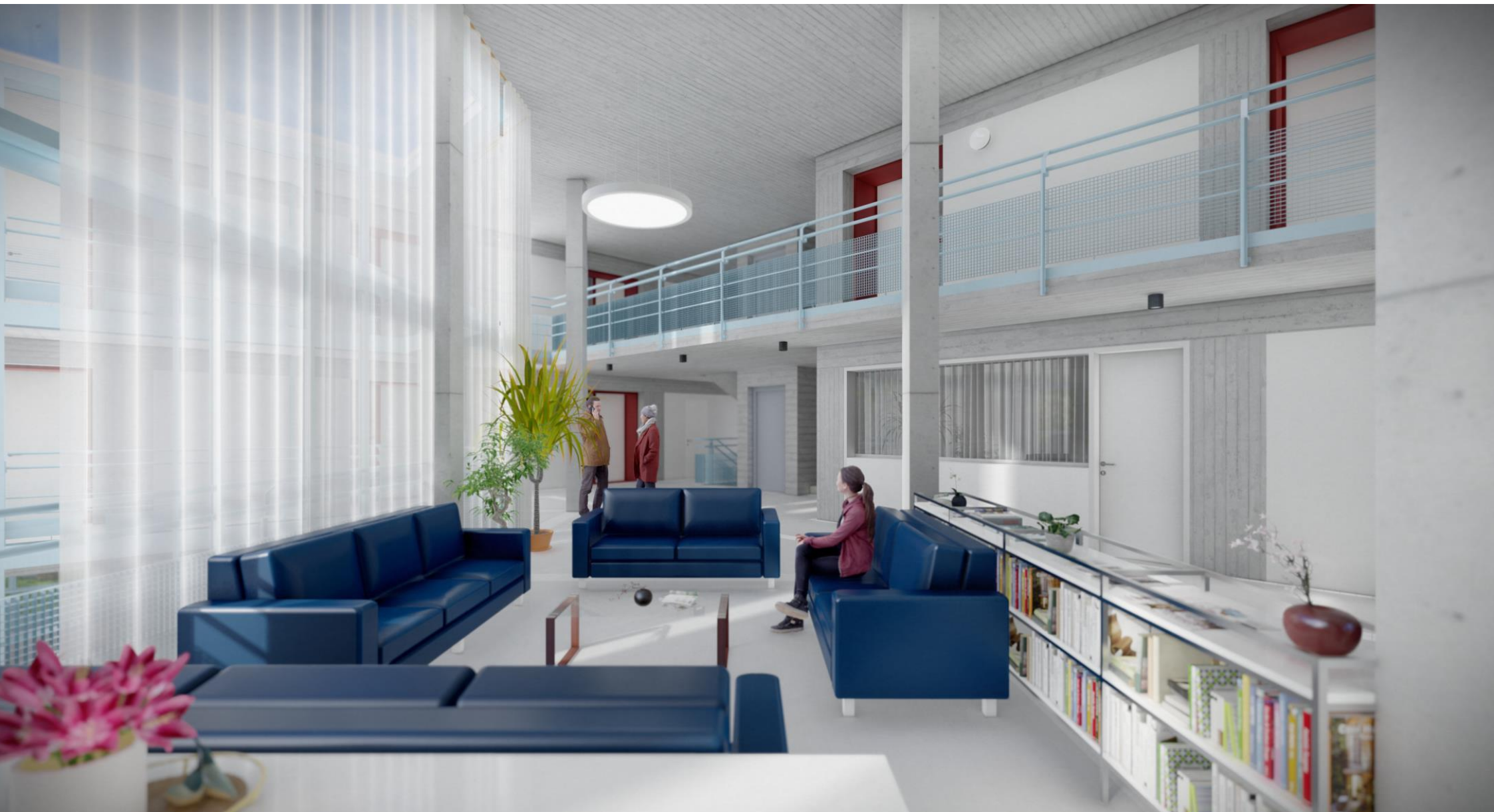
Vista da salone comune