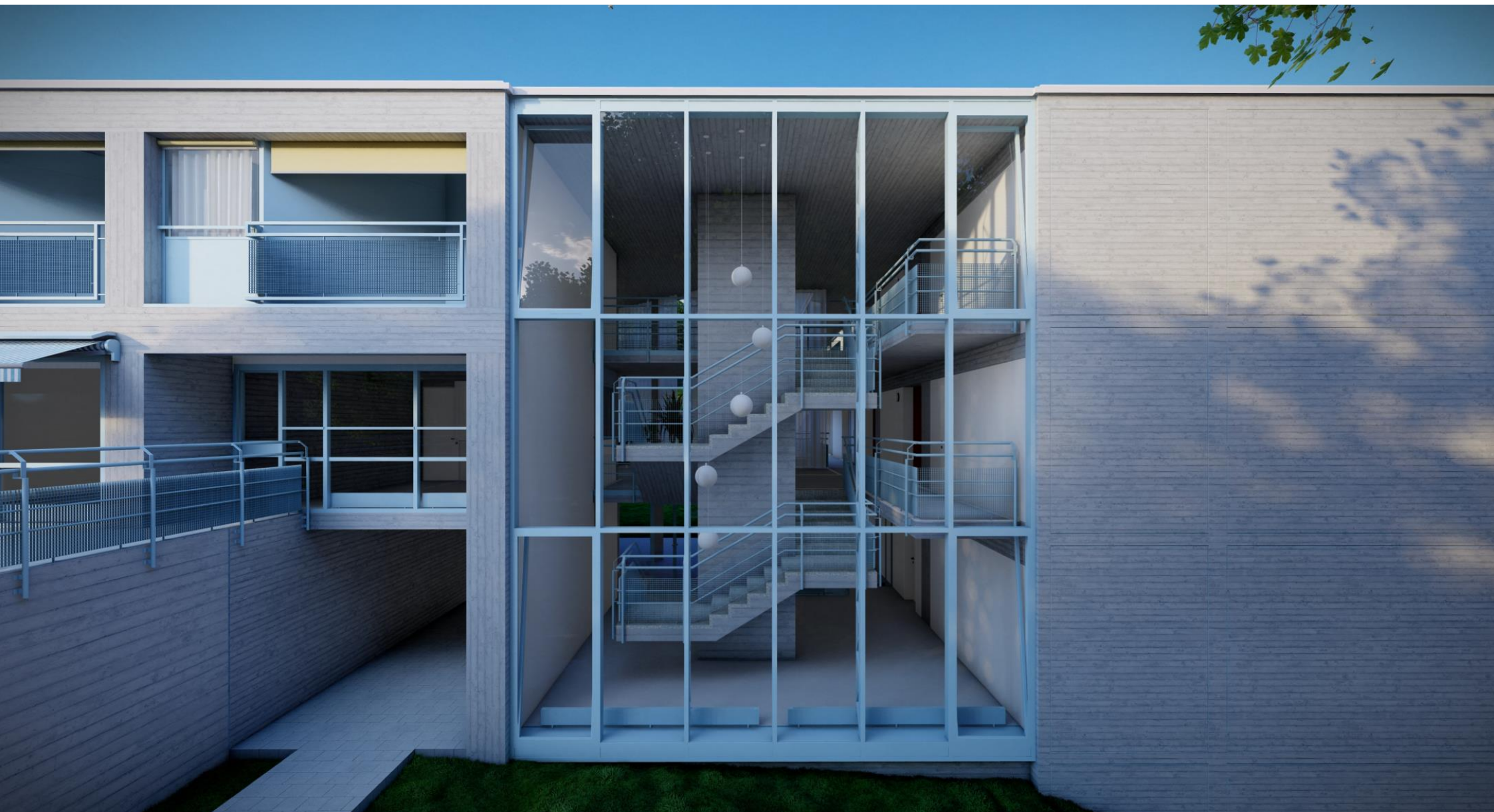
Vista facciata nuovo serramento su vano scale