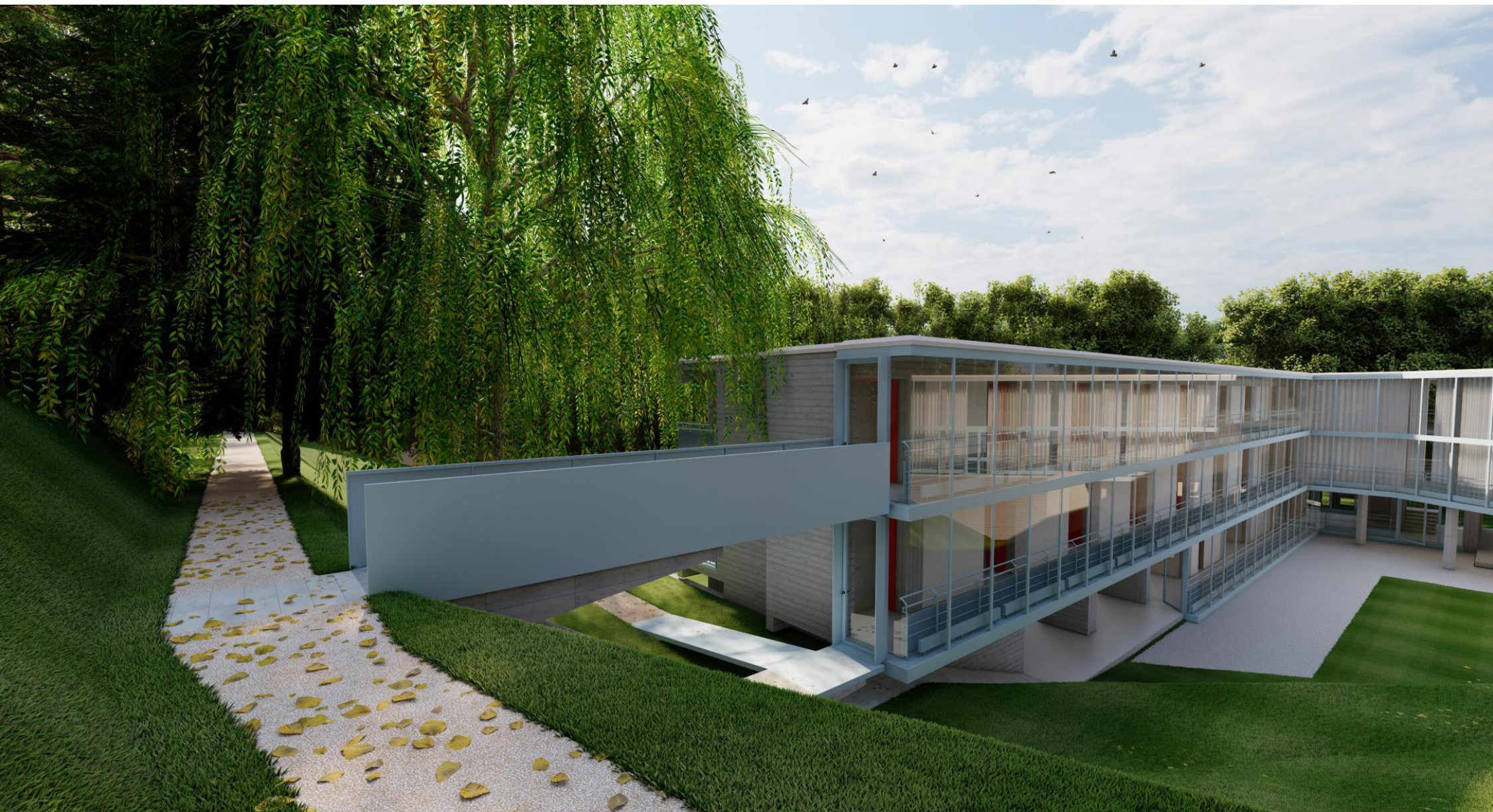
Vista passerella uscita di sicurezza al 2P