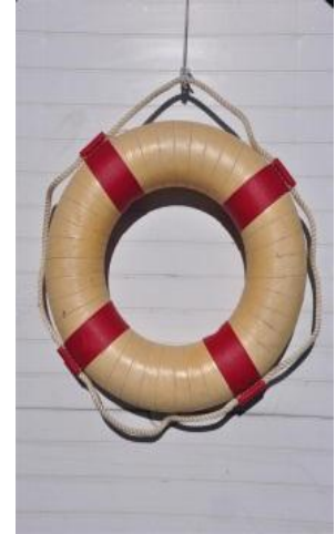
Rettungsring Bouée de sauvetage Salvagente anulare