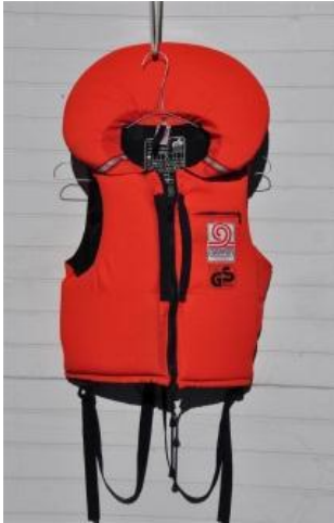
Rettungswesten mit Kragen Gilet de sauvetage avec col Giubbotti di salvataggio con collo

Auftrieb von mindestens 75 N / Poussée hydrostatique d'au moins 75 N / Spinta idrostatica di almeno 75 N