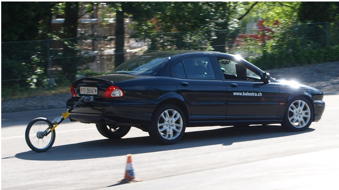
Reazione e frenata durante i test.