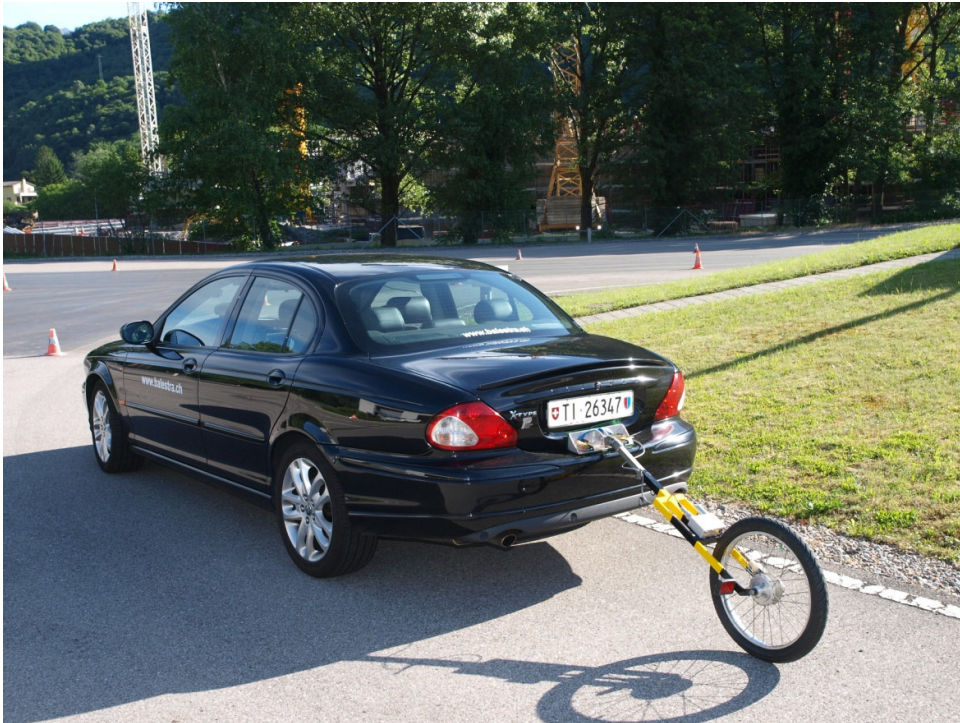
Il veicolo-laboratorio utilizzato per i test.