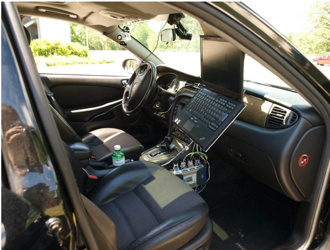
Il veicolo-laboratorio utilizzato per i test (interno).