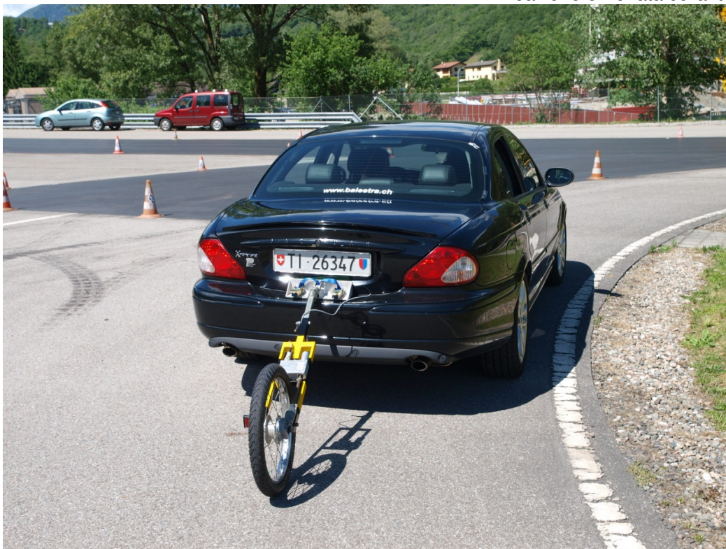
In azione durante i test.