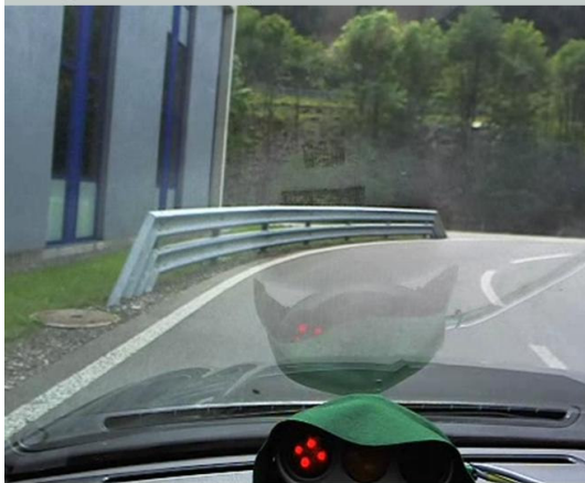
Videocamera frontale - stimolo reattivo