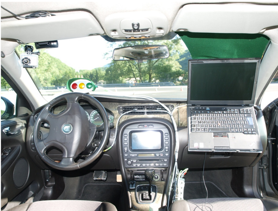
Il veicolo-laboratorio utilizzato per i test (interno).