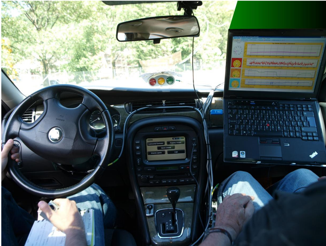
Il veicolo-laboratorio utilizzato per i test (interno).