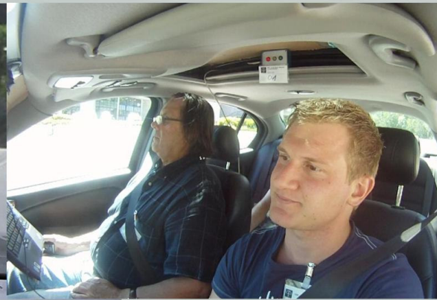
Videocamera facciale - analisi delle espressioni emotive