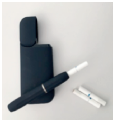
Esempio di un prodotto a tabacco riscaldato

La differenza principale di questi nuovi dispositivi rispetto alle sigarette elettroniche è che contengono tabacco. Il prodotto si presenta come un cilindro autoriscaldante alimentato da una pila nel quale va inserita una mini-sigaretta di circa 3 cm a base di tabacco chiamata stick e dotata di un filtro che ricorda quello della sigaretta tradizionale. Una volta attivato, il dispositivo riscalda il tabacco a una temperatura inferiore rispetto a quella a cui viene bruciato il tabacco delle sigarette tradizionali e quindi non produce cenere. In assenza di combustione si eliminano o diminuiscono la maggior parte delle sostanze dannose del tabacco e si riducono quindi i rischi per la salute: questa almeno la tesi dell'industria. Tra questi nuovi prodotti a tabacco riscaldato sono da citare la iQOS™ che Philip Morris ha lanciato sul mercato svizzero nell'agosto del 2015, la glo™ di British Ame-