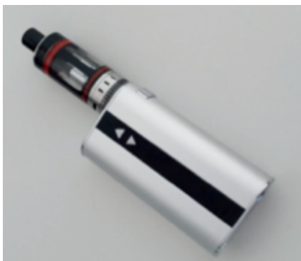
Esempio di una sigaretta elettronica

A distanza di alcuni anni dall'arrivo sul mercato gli esperti del settore concordano: la sigaretta elettronica è meno nociva della sigaretta tradizionale poiché non vi è inalazione dei prodotti della combustione del tabacco, in particolare catrame e idrocarburi policiclici