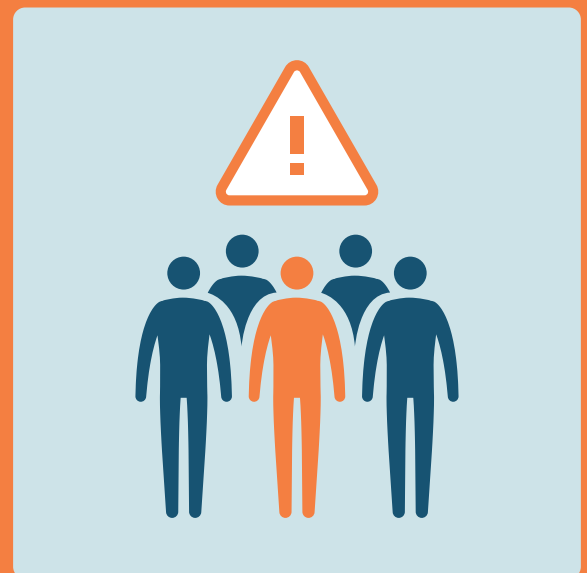
Evitare luoghi affollati