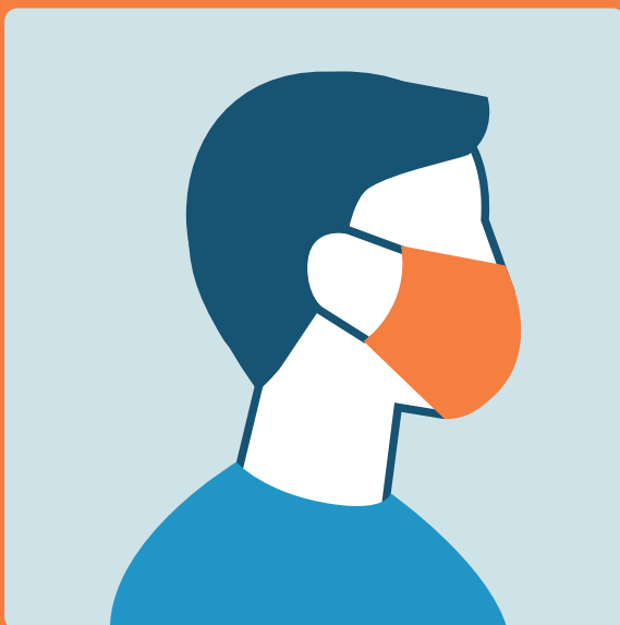
Usare la mascherina