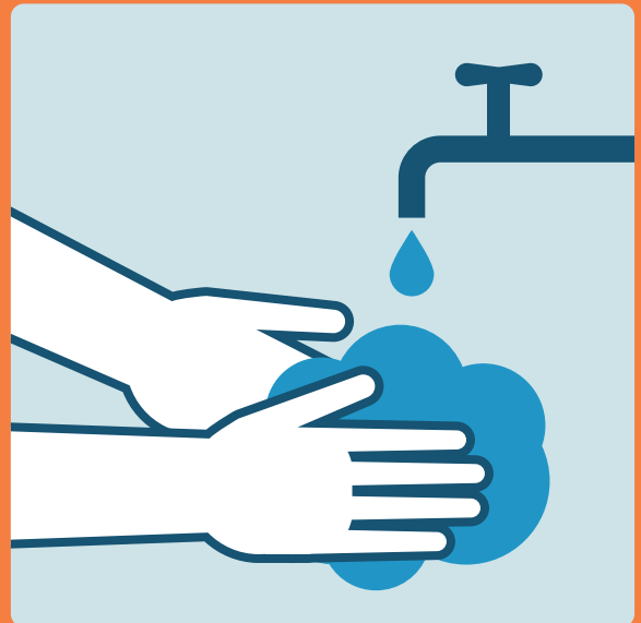
Lavarsi le mani