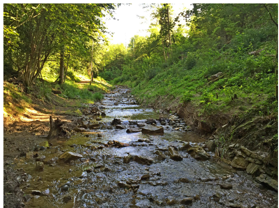
Il Roncaglia, prima (a sinistra) e dopo gli interventi di rivitalizzazione (a destra).