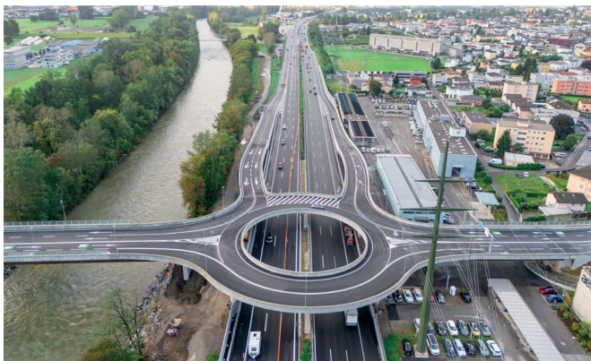
Veduta del Semisvincolo da nord