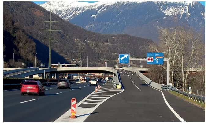
Nuova uscita autostradale da sud