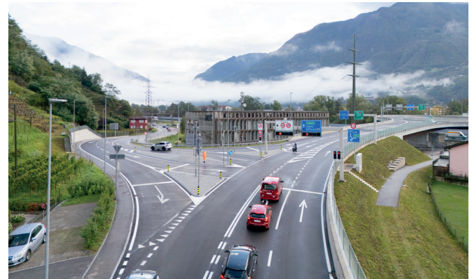
Incrocio Monte Carasso