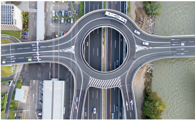
Vista planimetrica del Semisvincolo