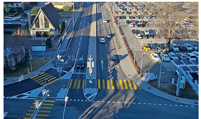
Incrocio di via Tatti con via Zorzi

A partire da mercoledì 5 febbraio 2025 il Semisvincolo di Bellinzona Centro sarà completamente operativo sia in entrata verso sud, sia in uscita da sud.