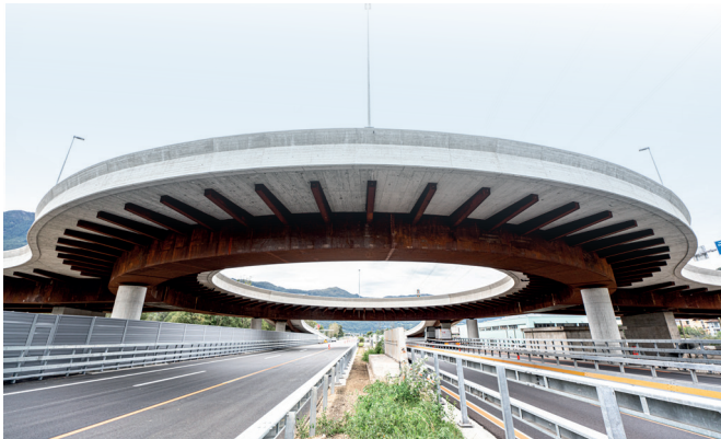
La rotonda sopraelevata del Semisvincolo vista dal basso