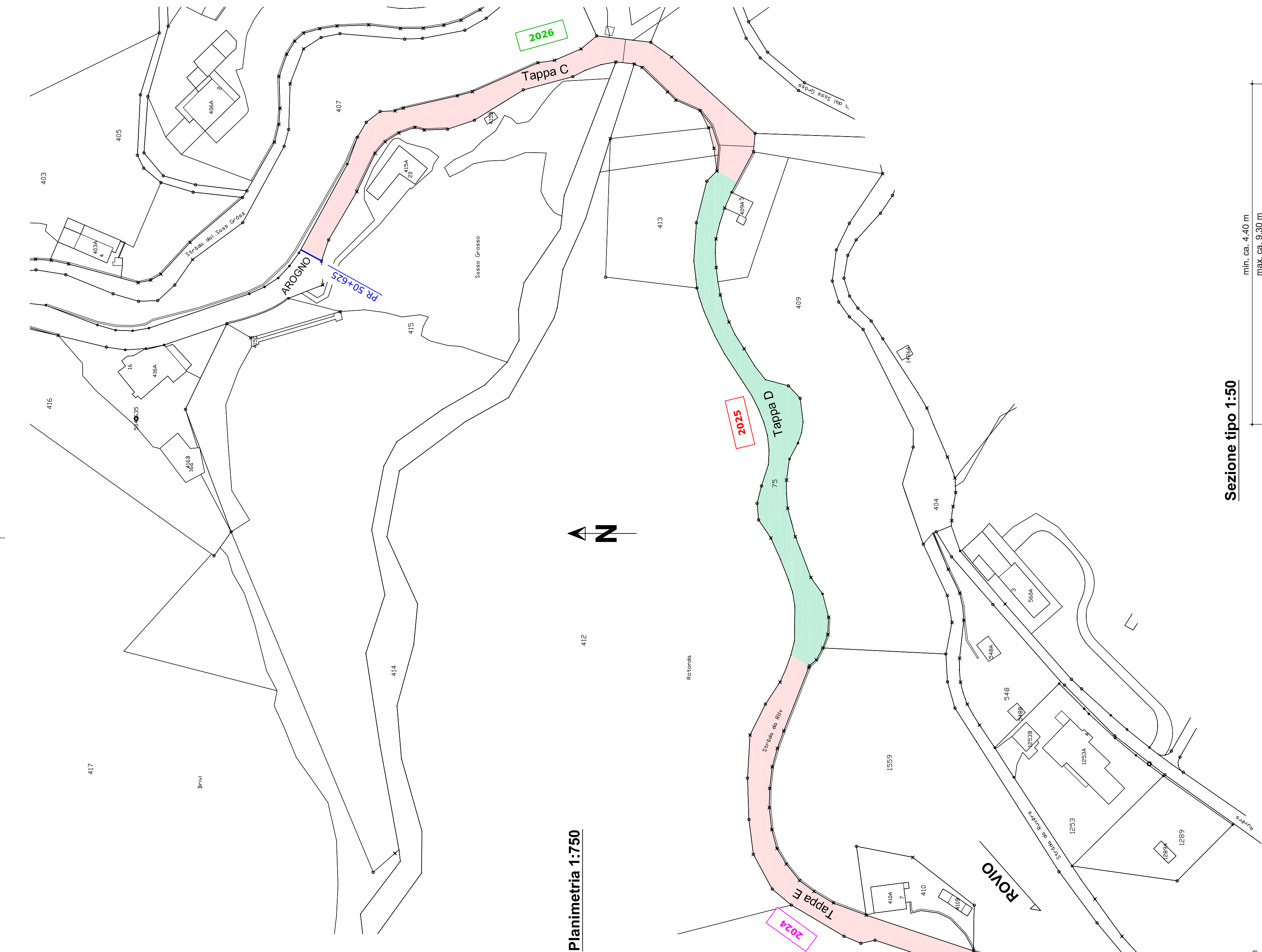
Sezione tipo 1:50