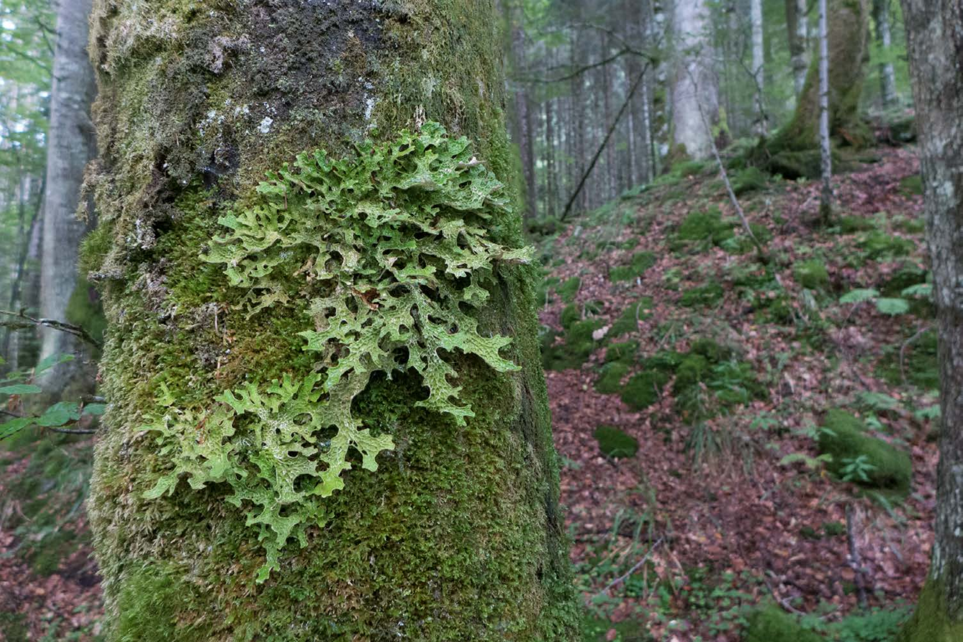
Lichene con alghe verdi