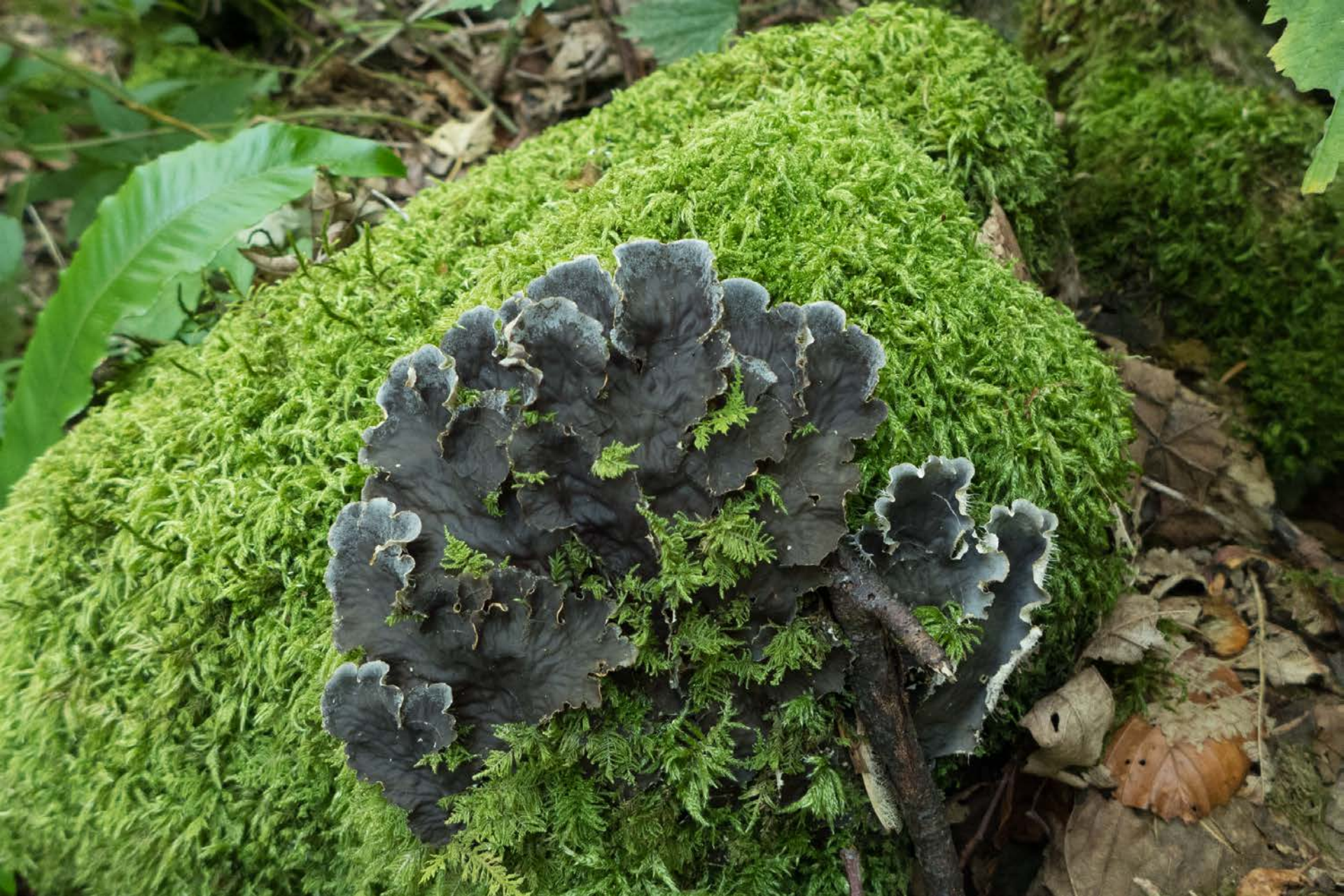
Lichene con cianobatteri (« alghe azzurre »)