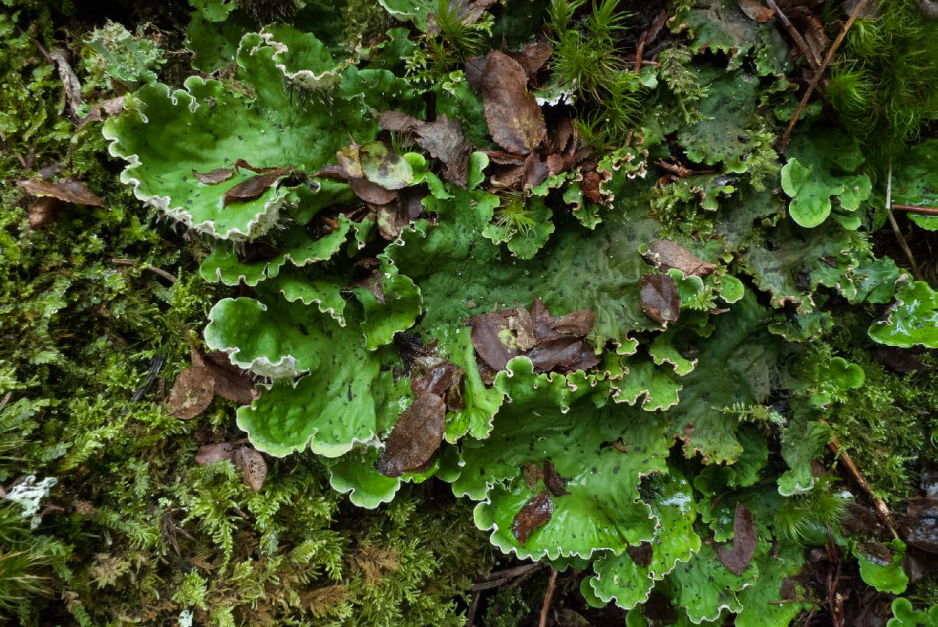
Lichene con alghe verdi e azzurre