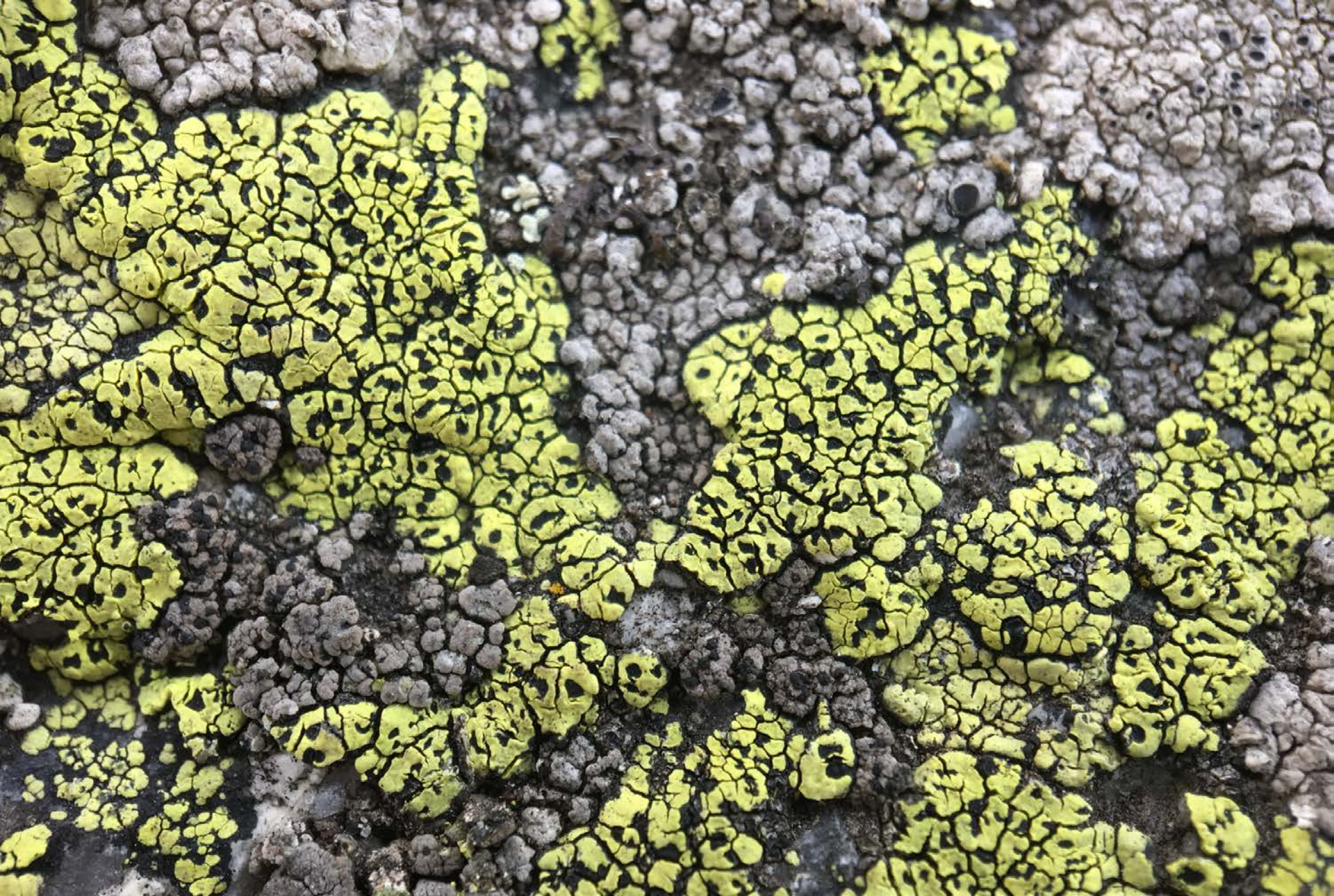
Lichene crostoso sassicolo