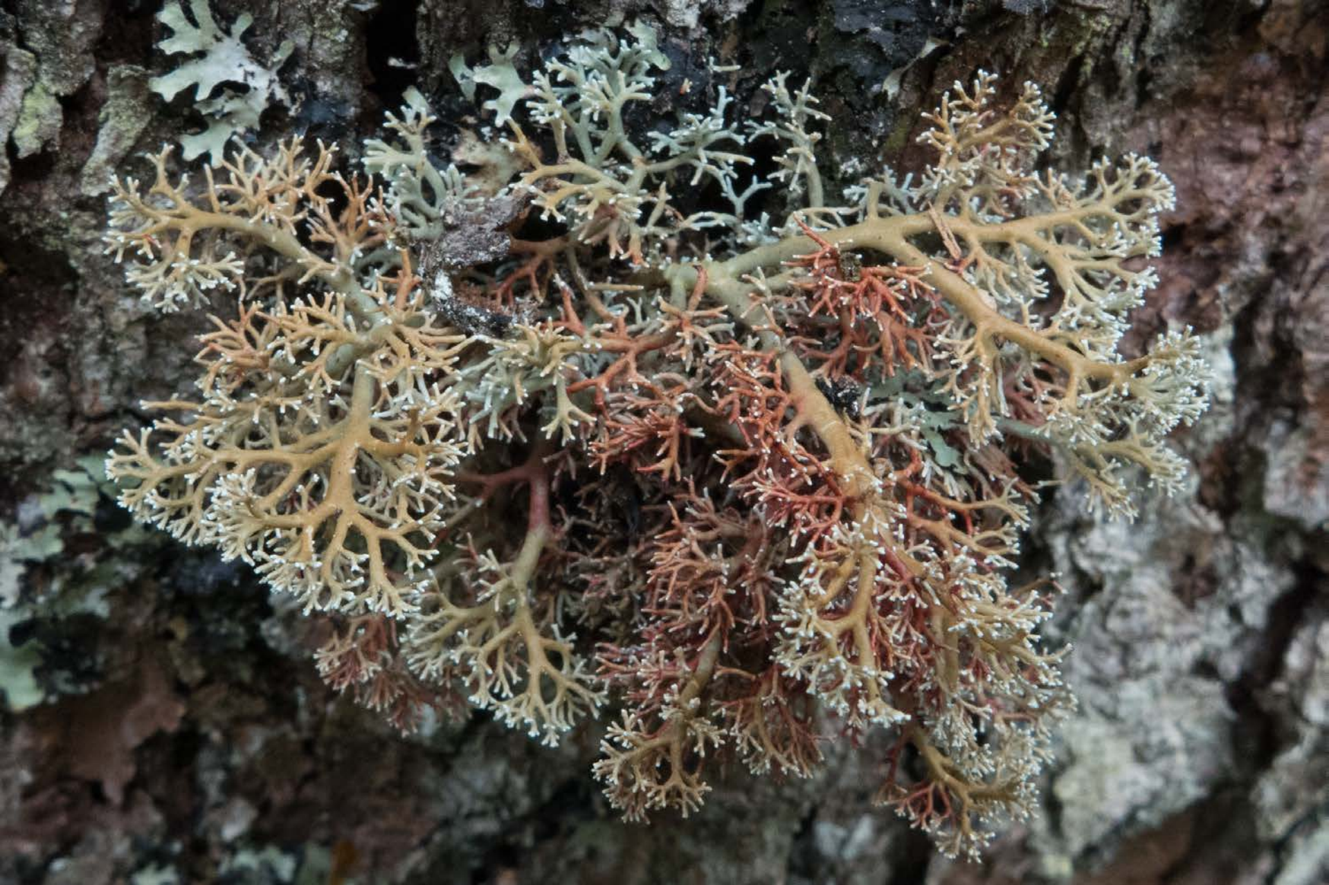
Sphaerophorus globosus protetta dall'ordinanza sulla conservazione della natura