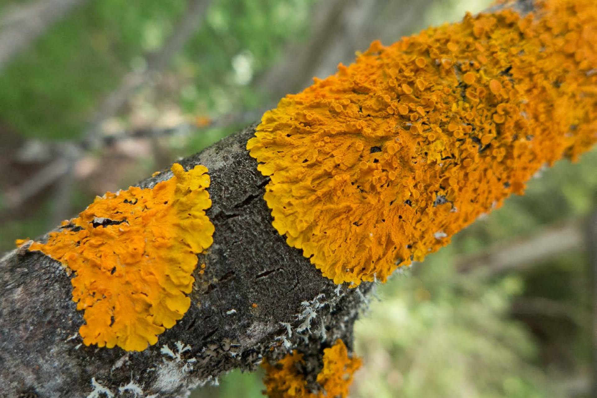
Lichene foglioso corticolo