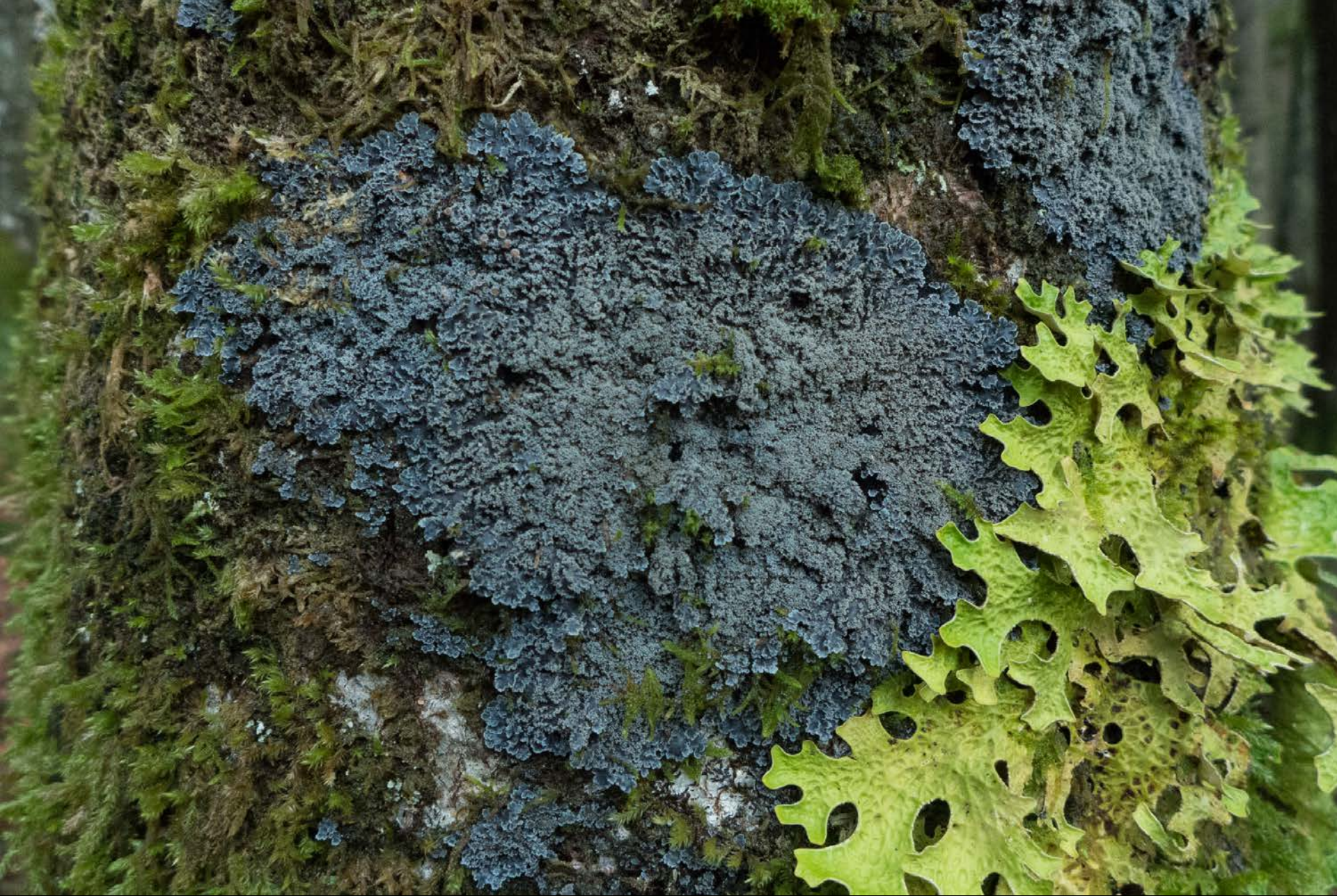
Pannaria conoplea protetta dalla legge cantonale sulla protezione della natura