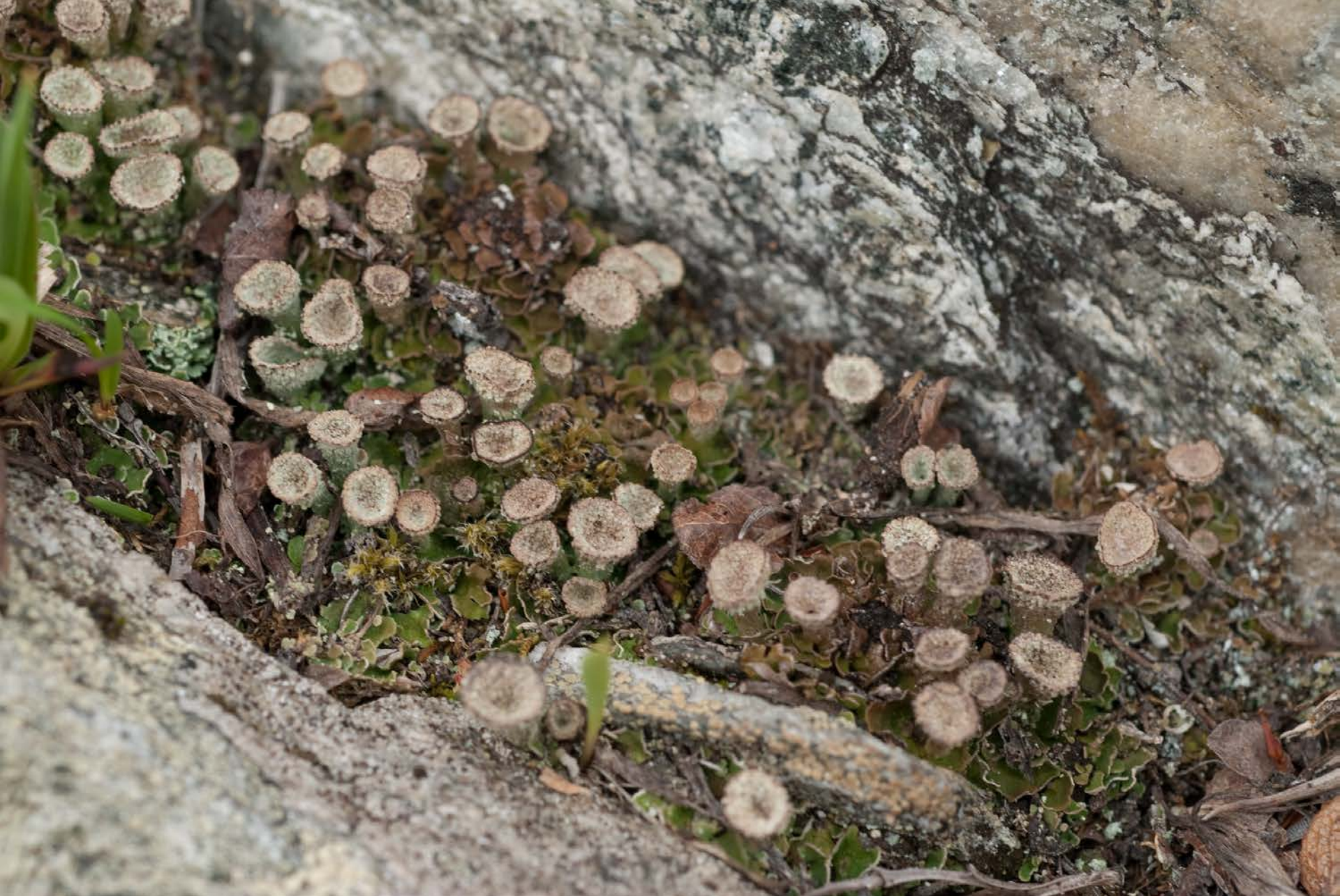
Lichene a squamule basali e podezi