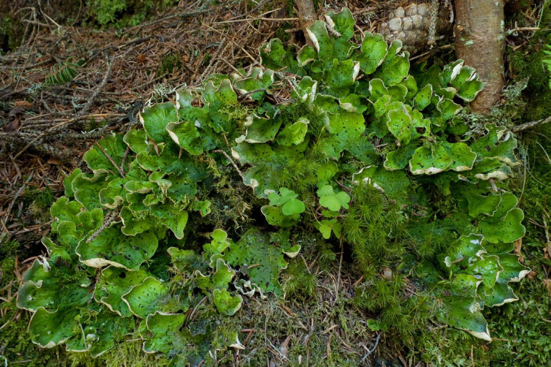
I licheni catturano \text{CO}_2 ed emettono \text{O}_2 , come le piante Peltigera aphthosa