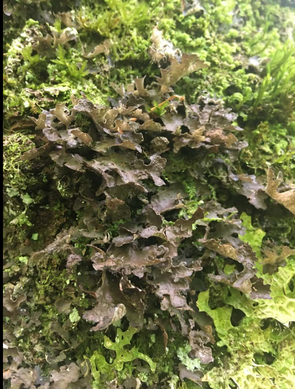
Sticta sylvatica protetta dall'ordinanza sulla conservazione della natura