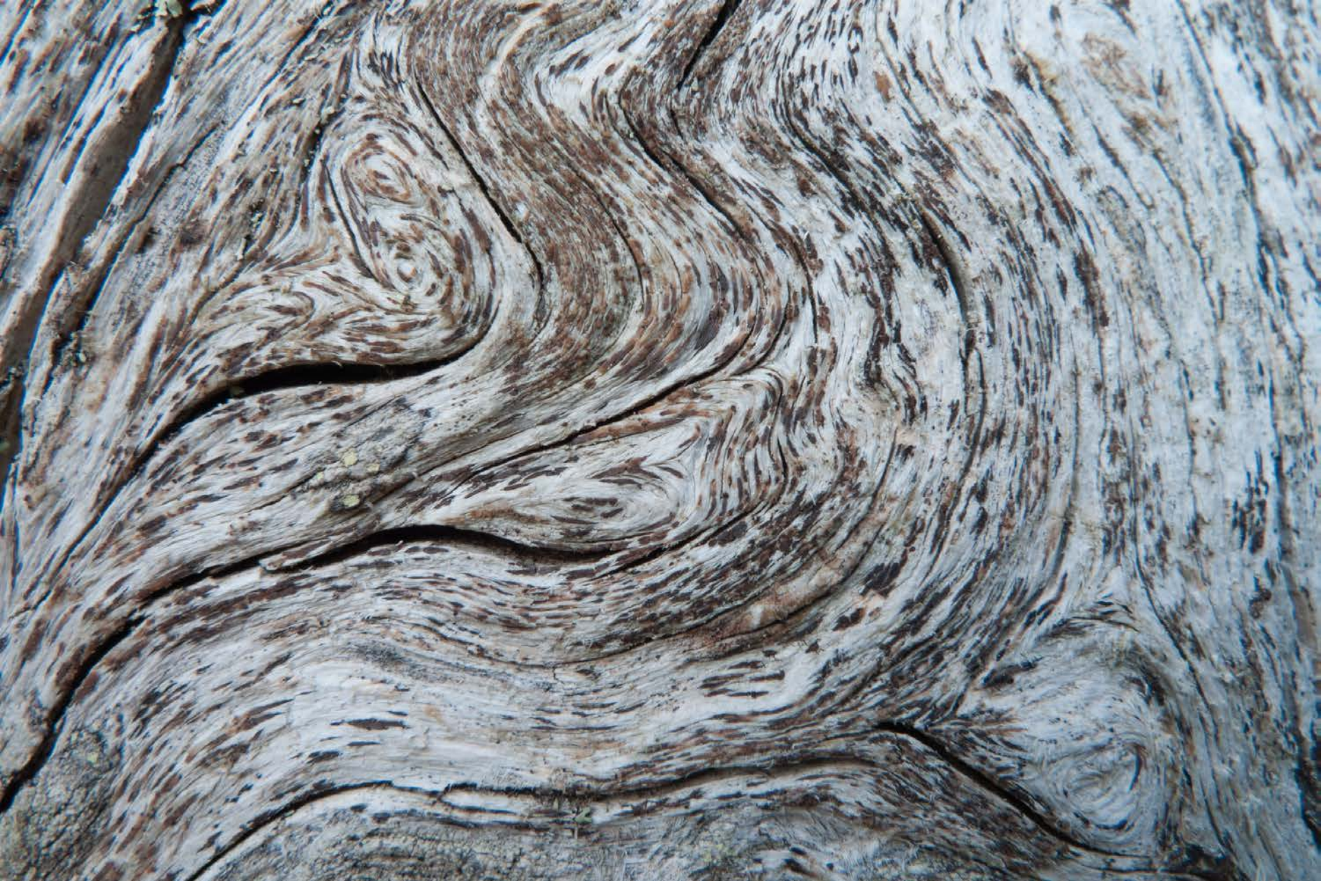
Lichene crostoso lignicolo