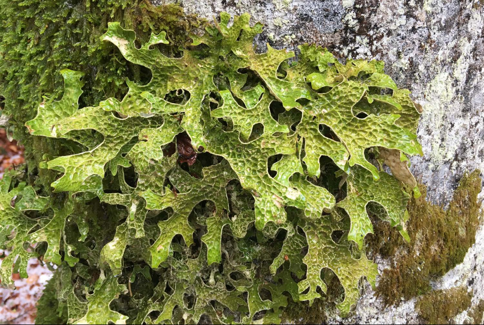
Lobaria pulmonaria protetta dall'ordinanza sulla conservazione della natura