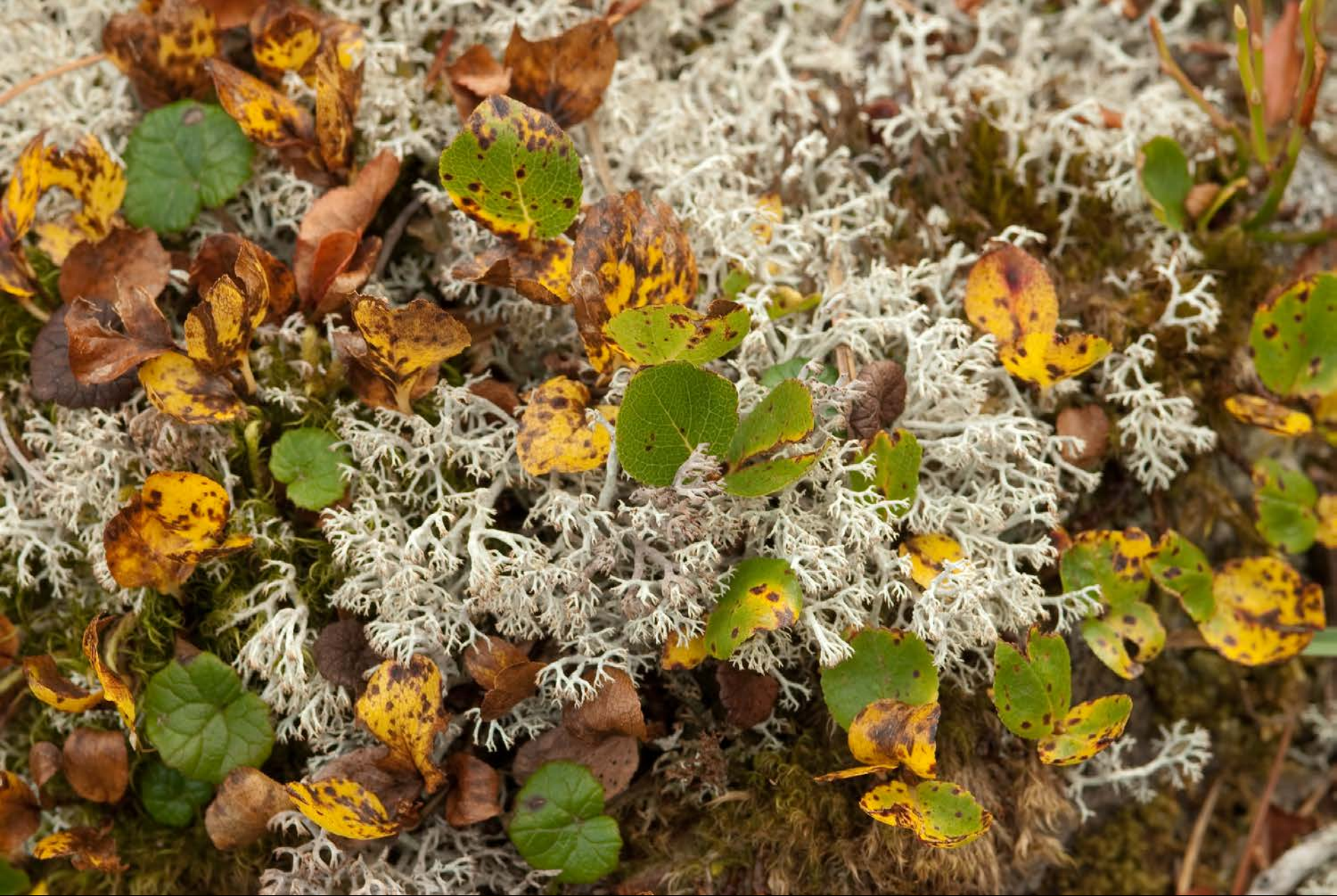
Lichene fruticoso terricolo