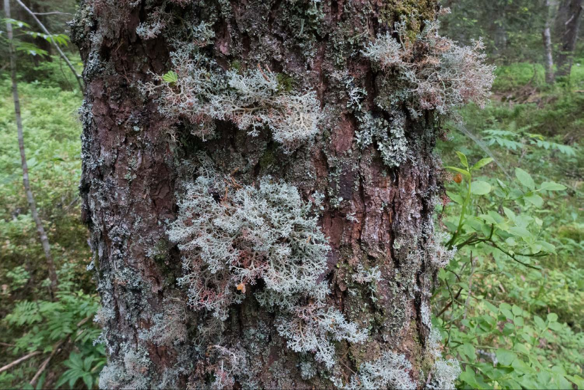
Sphaerophorus globosus protetta dall'ordinanza sulla conservazione della natura