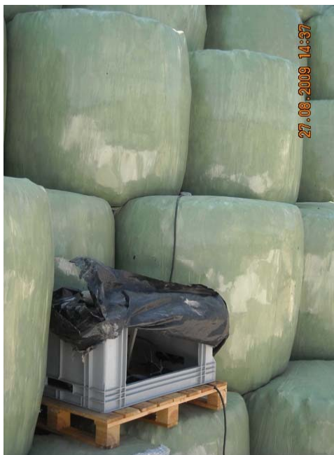
Punto di misura dell'analisi D

Un'osservazione accurata ha portato a posare lo strumento di misura tra le ecoballe della seconda fila e terza fila dal basso, sul lato est a circa metà della lunghezza della catasta "sud", inserendo la prolunga nei relativi interstizi. Anche in questo caso sono state verificate le concentrazioni ad una distanza di 5 metri in linea retta dal punto di misura. Lo strumento, calibrato prima delle analisi, ha memorizzato in continuo i valori minimo, medio e massimo rilevati sull'arco di 10 minuti.