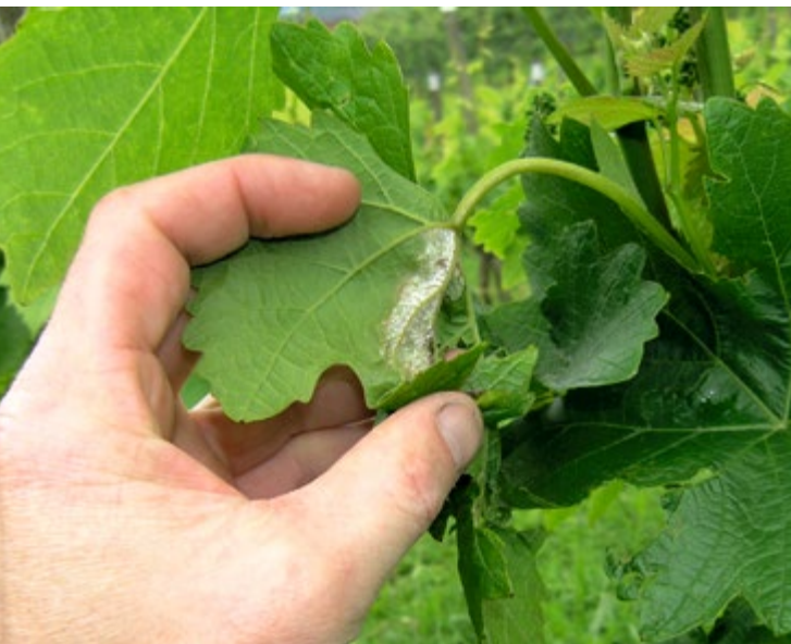
Peronospora su vite.