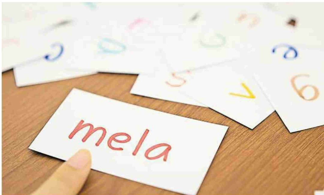
Immer weniger Schweizer lernen Italienisch als Fremdsprache.

Sprachenstreit In der italienischen Schweiz verfolgt man die Diskussion um das Frühfranzösisch in den Deutschschweizer Primarschulen mit Erstaunen. Denn über Italienisch wird nie gesprochen.