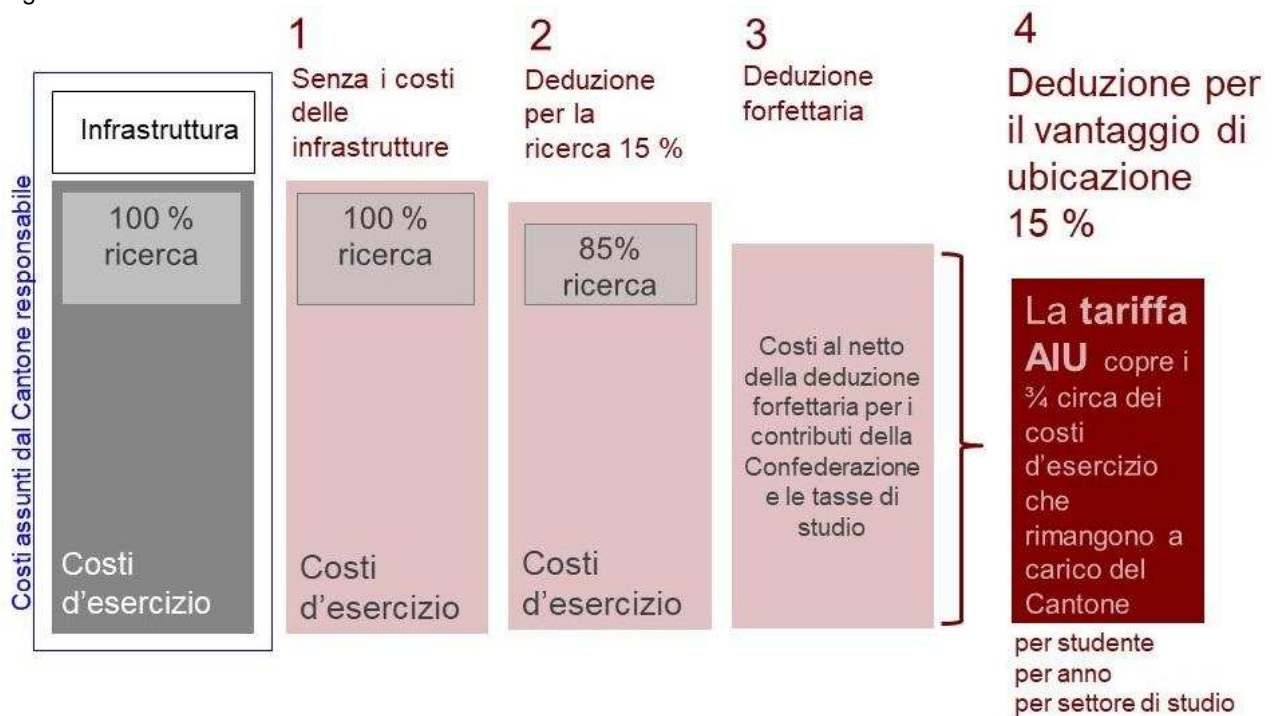
Figura 1 Schema del sistema di calcolo dei contributi intercantionali da AIU 2019